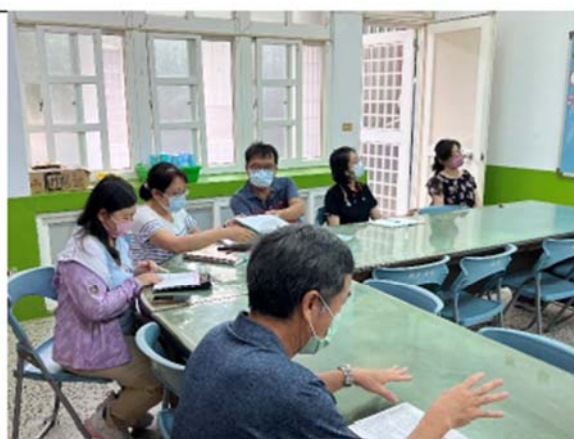
校長報告相關事項