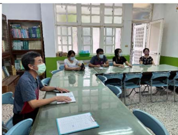
實體+線上混成的課發會