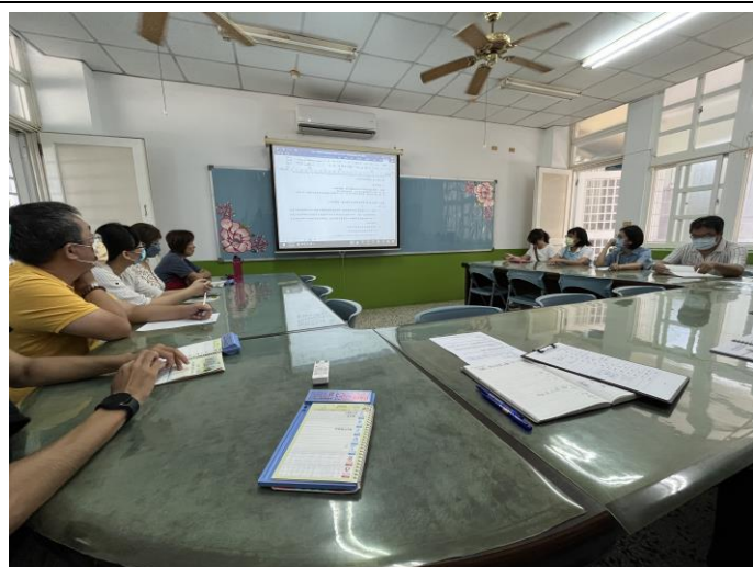
夥伴對課程評鑑成果提出修正意見