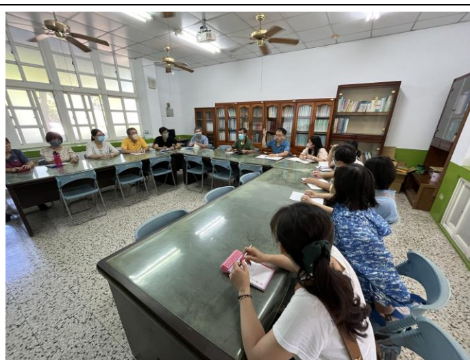
夥伴對課程計畫提出修正意見