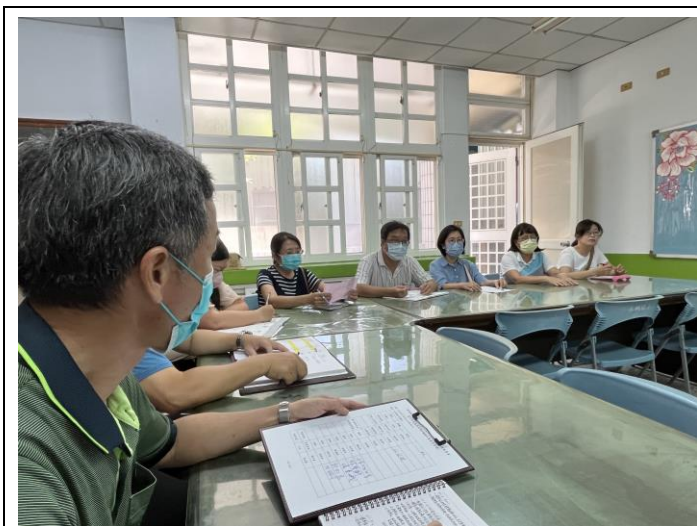
課發會的主席報告