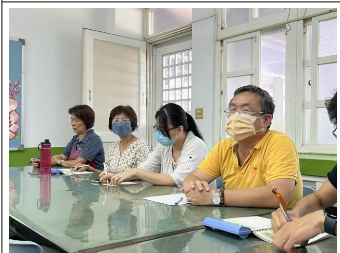
輔導組長對特教課程計畫的工作報告