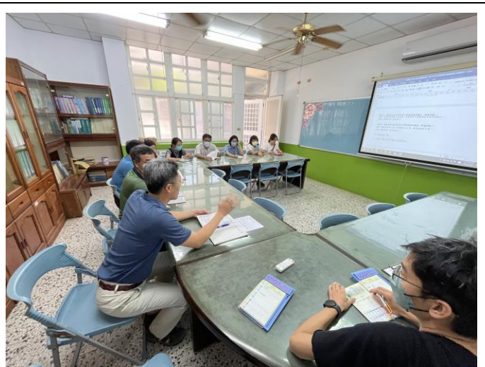
謝主任對夥伴寫的課程計畫提出修正意見