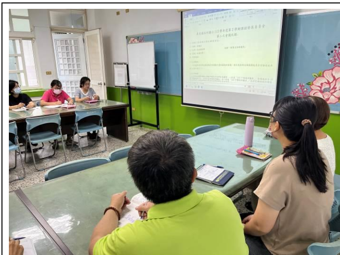
課發會的主席報告