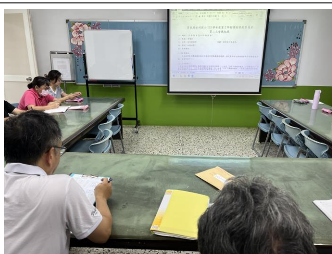
夥伴對課程計畫提出修正意見