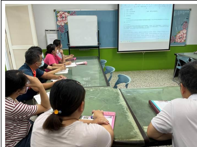
陳主任對第二次課發會的工作報告