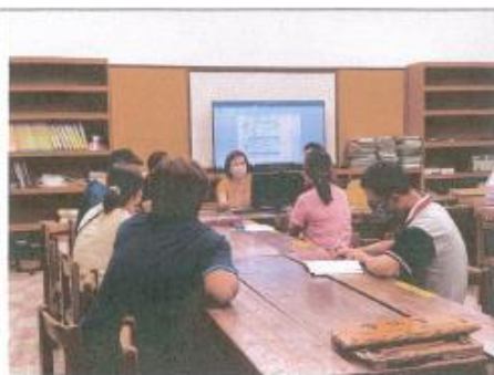
教學組長說明各年級彈性課程規劃