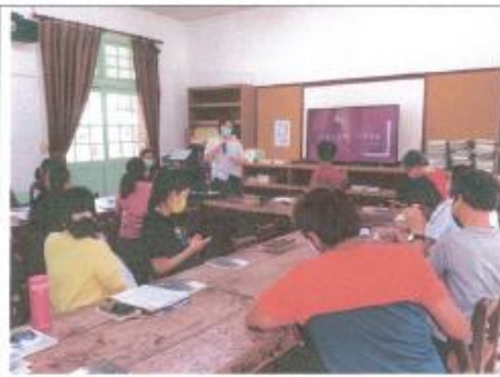
教學組長業務說明