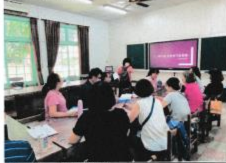
特教課程計畫審查