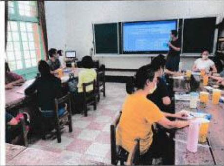
作息時間調整說明