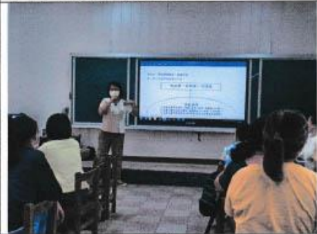
學校課程願景審議