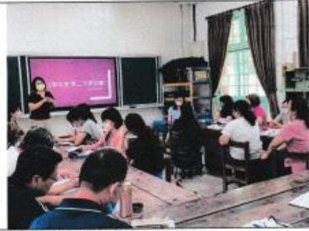
教務組長業務說明