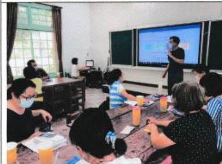
彈性課程調整說明