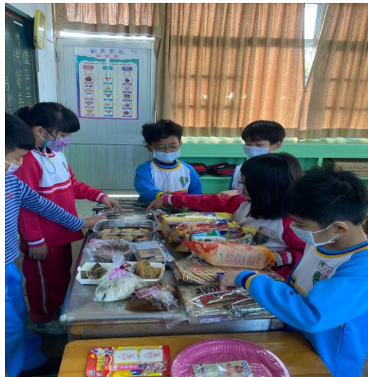
說明：選出自己最愛的米製品