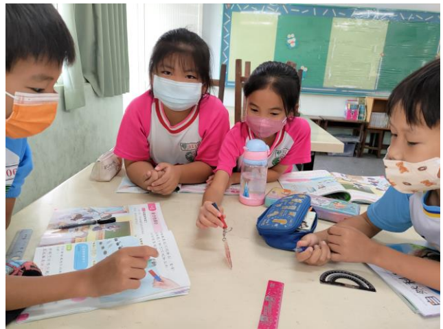
說明：分組進行「磁力的探討」的實驗