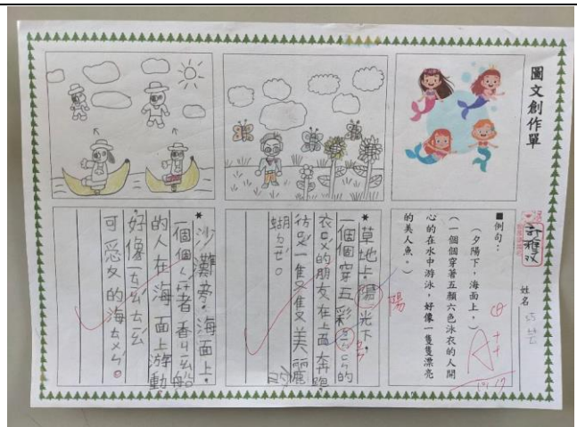
說明：句型練習與創作