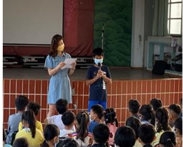
閱讀心得分享—每周一朝會學童上台分享