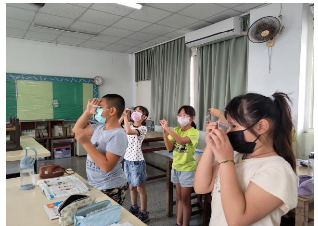
說明：老師講解及實地操作高度角觀測器