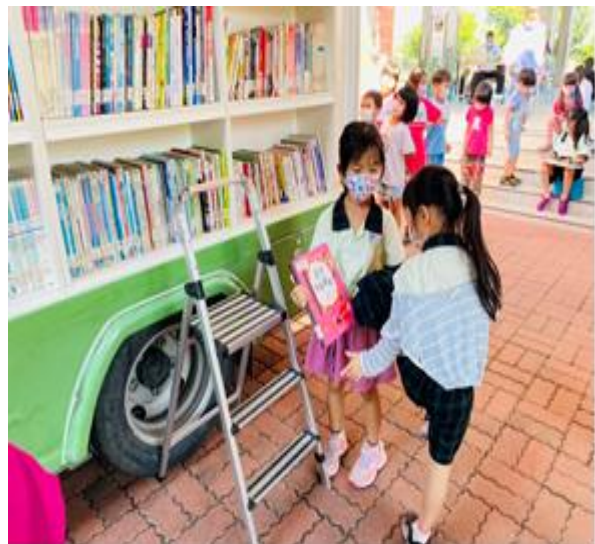
佛光山雲水書車巡迴—學童閱讀一隅