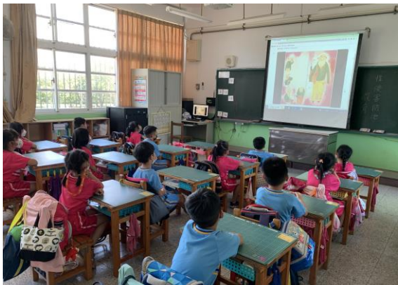
觀賞電子繪本書籍