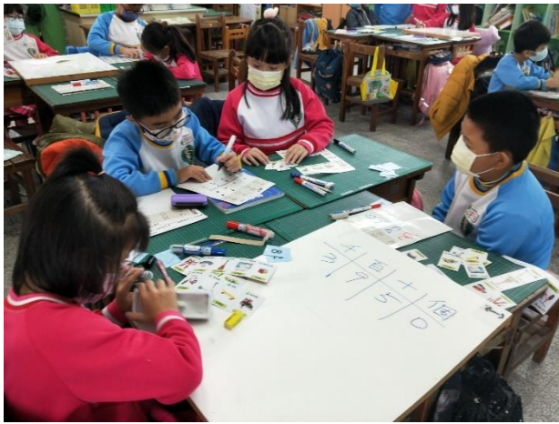
說明：學童操作~課本購物高手數學遊戲，並做紀錄