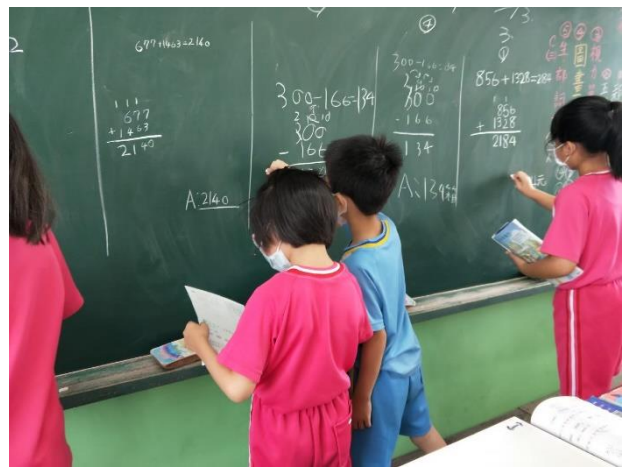
說明：學生上台練習計算數學題