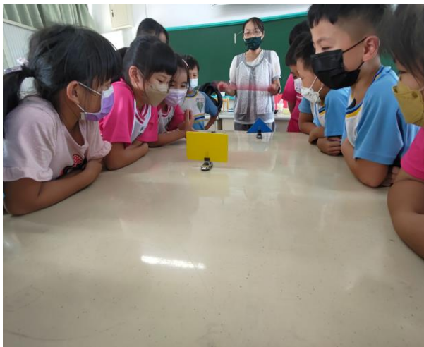
說明：進行「流動的空氣」的實驗