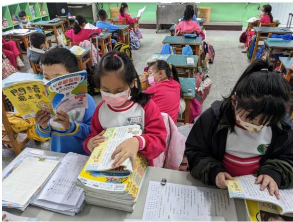
說明：每週練習朗讀共讀過的文章