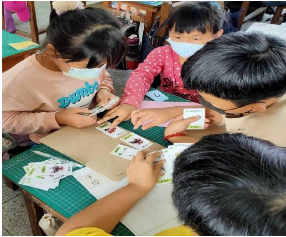
說明：學童操作~~課本購物高手數學遊戲