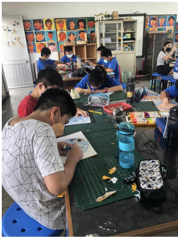
說明：紙雕創意設計雕刻