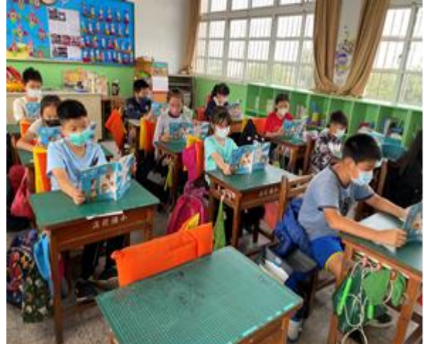
晨光閱讀時間--學童在專心閱讀