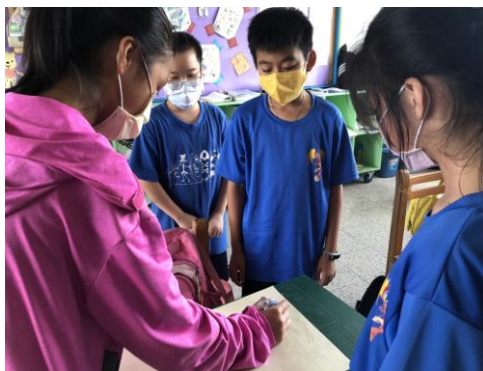
說明：小組討論與表達