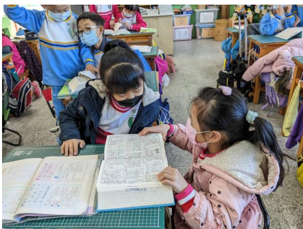
說明：練習查字典情形