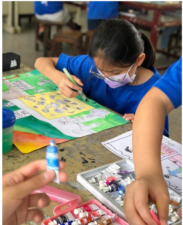
說明：水彩漸層上色練習