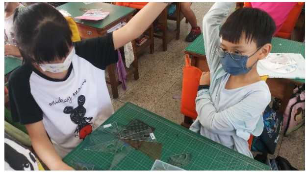
說明：學童動手操作用三角板拼出平角用三角板排出周角