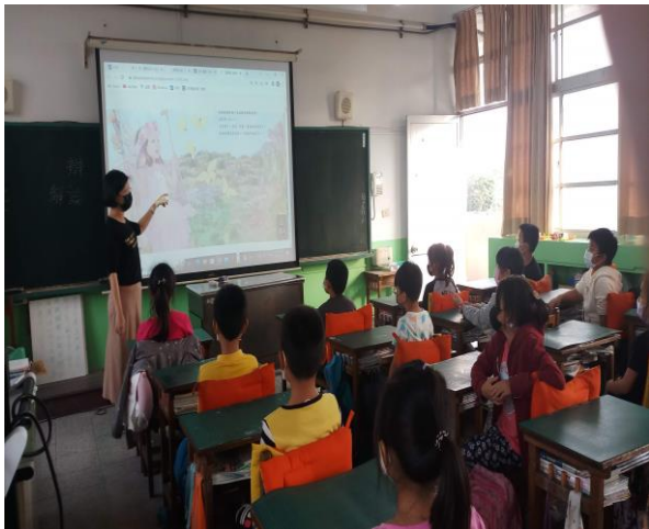
閱讀課—繪本共讀題問及延伸各議題