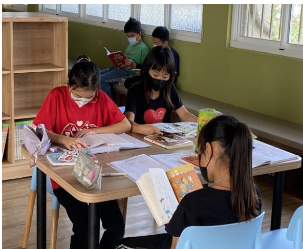
學童在圖書室閱讀