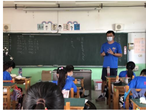
說明：教師引導與思考