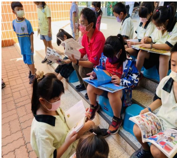
佛光山雲水書車巡迴— 校長陪學童閱讀