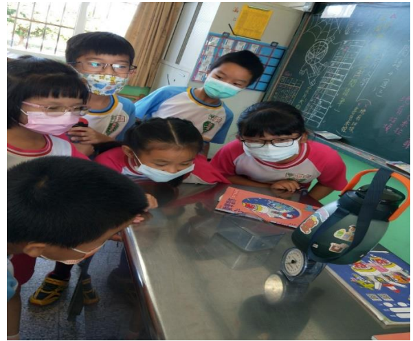
說明：學童利用磅秤來測量水壺的重量