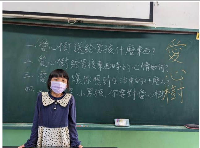
說明：共讀繪本後，討論並發表想法。