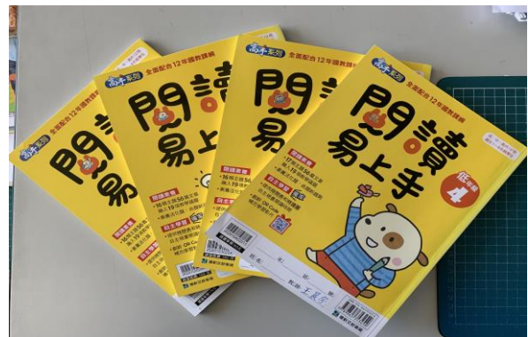
利用閱讀測驗的文章來加強閱讀理解的訓練