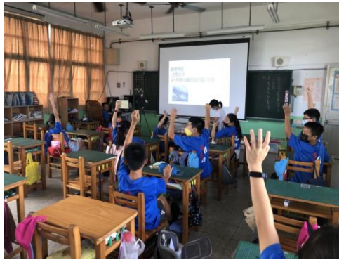
說明：學生上台發表與提問