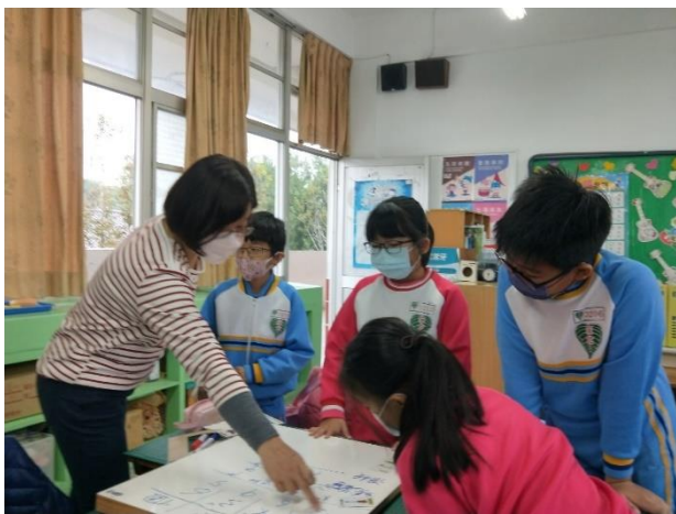
說明：老師指導學童如何做~購物高手數學遊戲紀錄