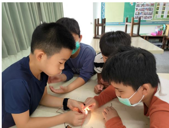
說明：分組進行連接各種電路的實驗