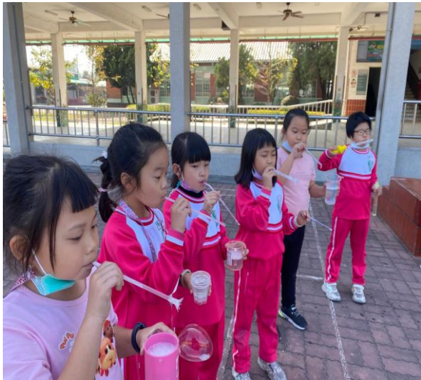
說明：吹泡泡真有趣