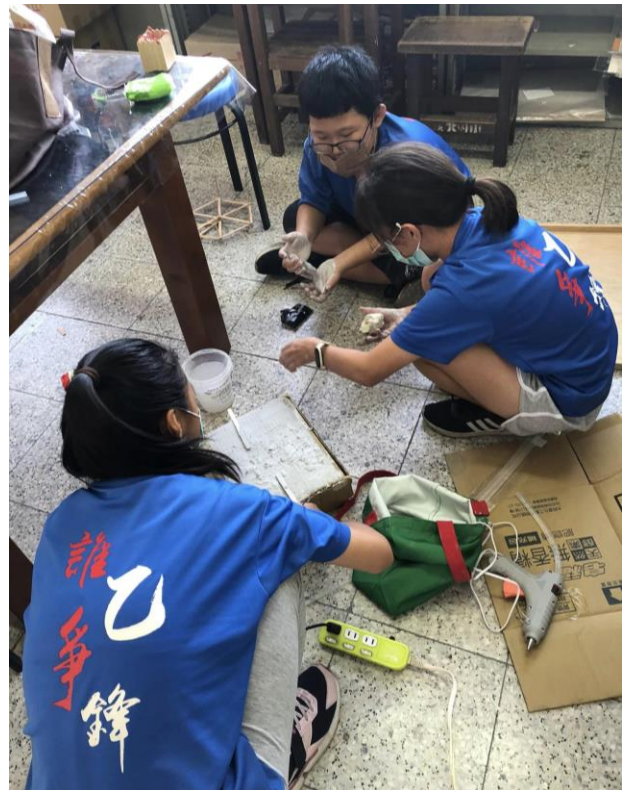
說明：複合媒材設計(小組團隊創作)