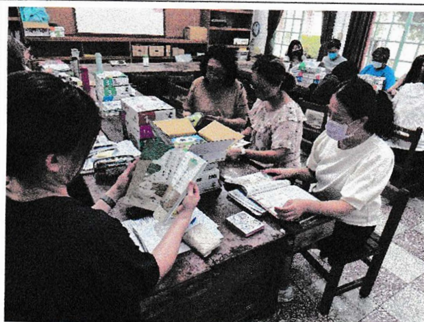
低年級教科書評選