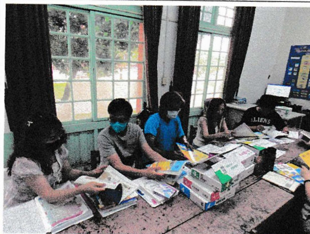
高年級教科書評選