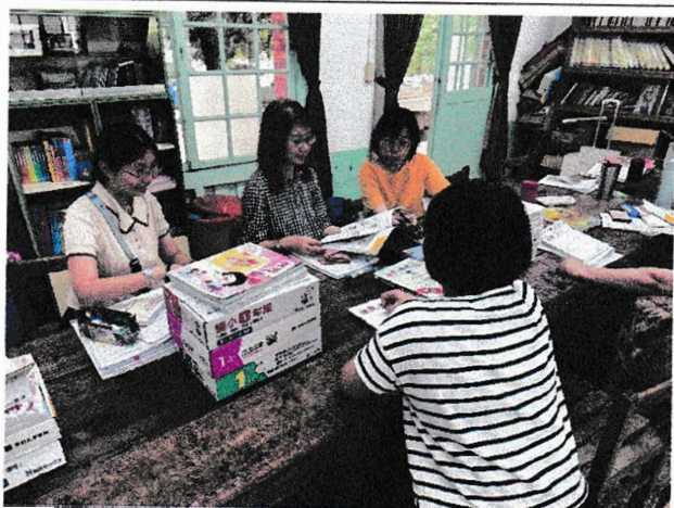
中年級教科書評選