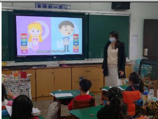
說明：理解性別平等