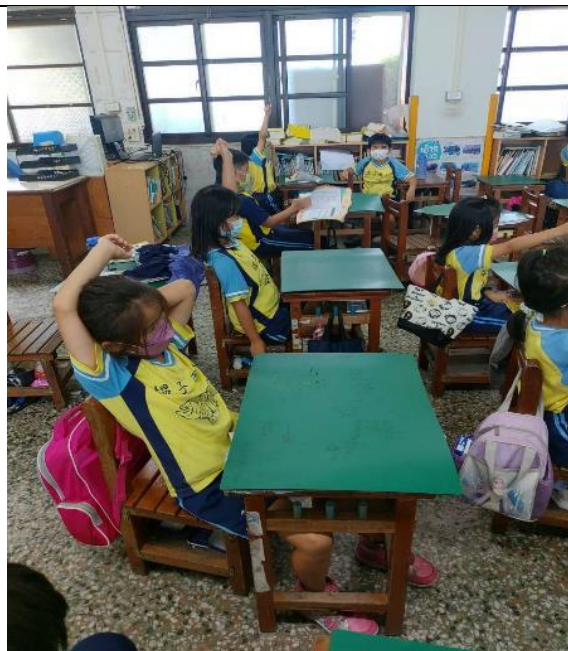
讓學生以舉手方式作答。