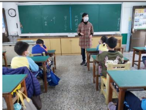
說明：討論職業類別上性別的刻板印象