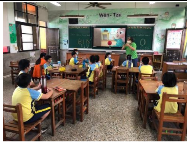
Listening to practice