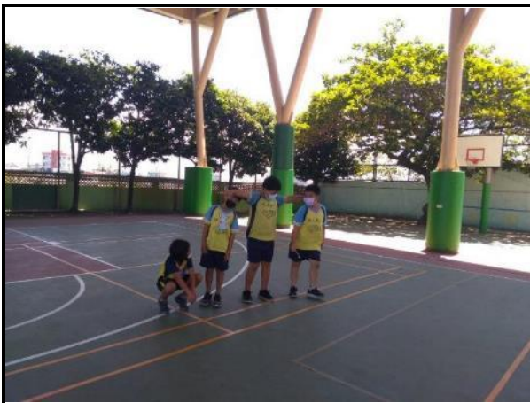
說明：生態活動，模擬大樹與生物共存。