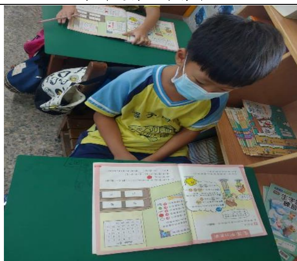
學生進行數學遊戲。