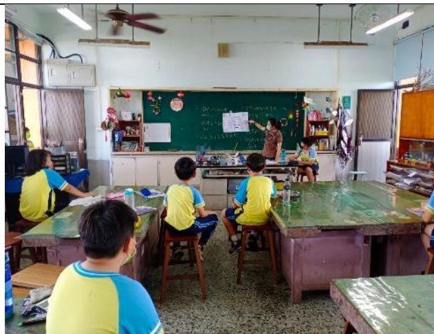
說明：圖片記憶遊戲