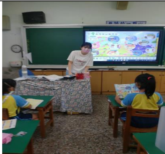
教師進行上課講解。