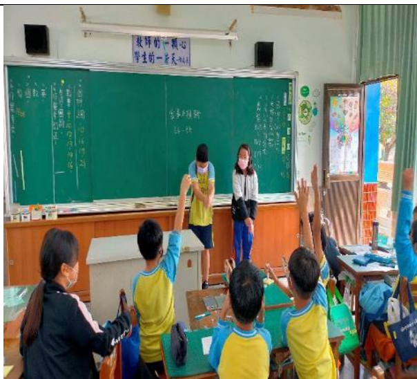
說明：家事超級比一比遊戲