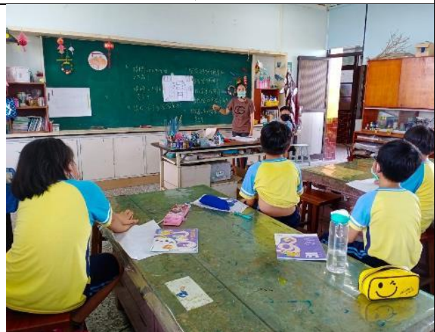
說明：解說圖片裡的物品名稱，接著進行測試。