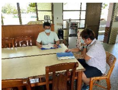
說明：討論課程內容