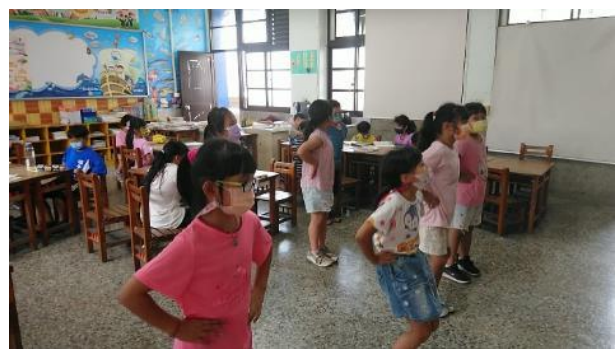
Let's play and sing