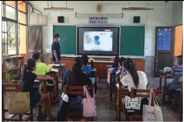
說明：教師讓學生觀看地下水相關影片