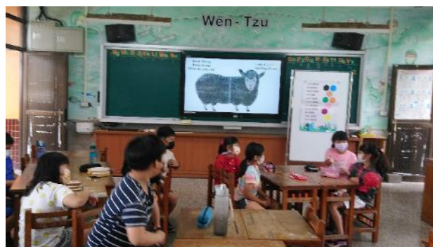
Brown bear! Brown bear! what do you see?