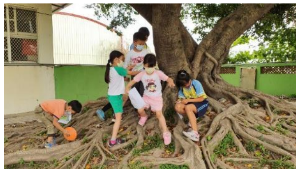
說明：探索校內自然資源