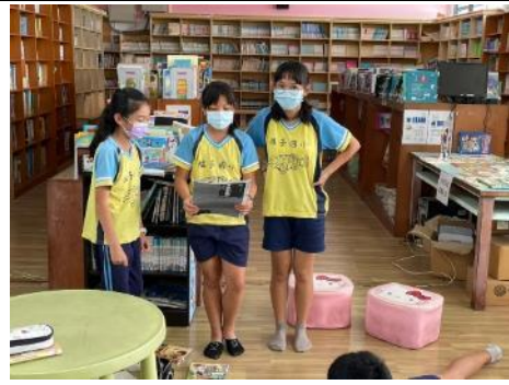
說明：分享小組報告內容