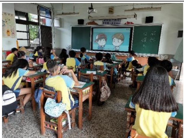
說明：教師以網路影片輔助教學