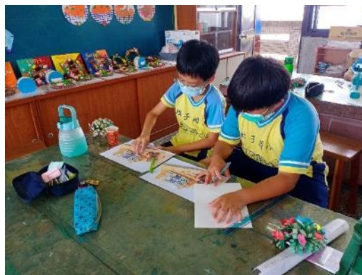
說明：作品模擬練習