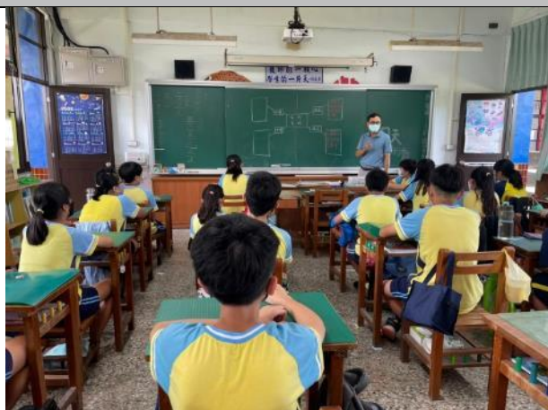
說明：各組彙整討論內容，並選出一位同學