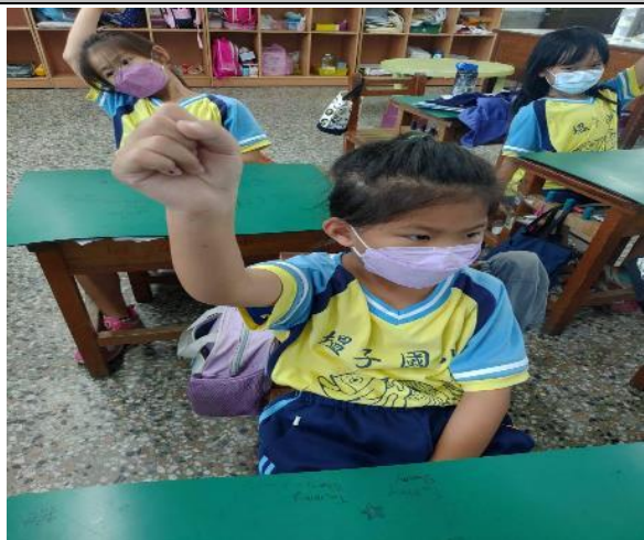
說明：學生針對課堂上學習內容舉手發問。