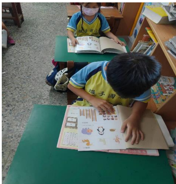
說明：學生以數學附件來協助學習。