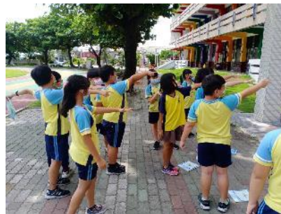
說明：學生分組實作實驗-測方位