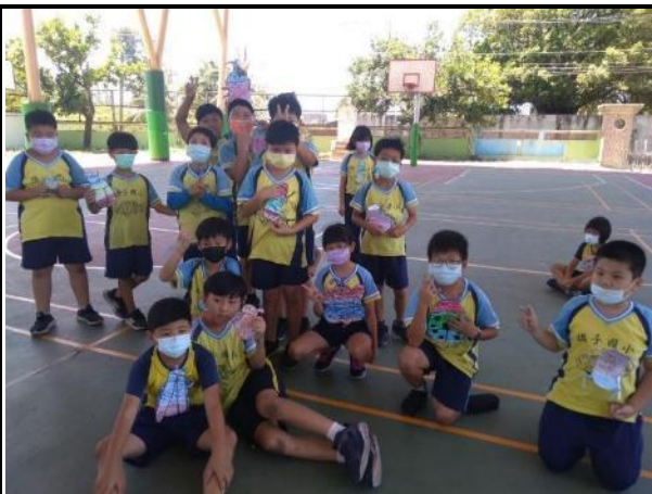
說明：利用拓印樹皮做成的生物。