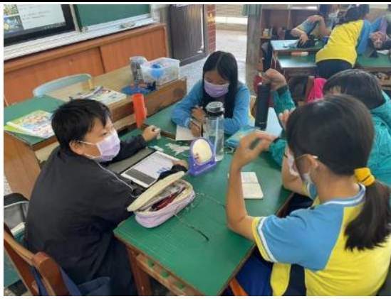
說明：學生分組討論