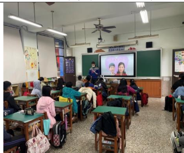
說明：觀賞完影片後讓學生分享自己與家人發生衝突的原因及解決方式。