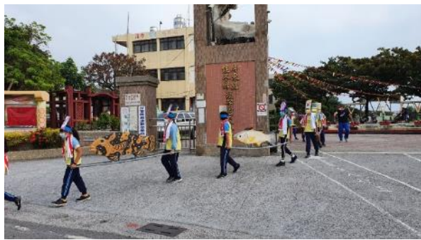
說明：結合校本課程進行社區巡禮