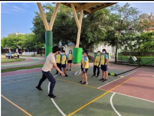
說明：教師羽球教學示範