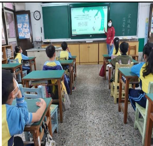
說明：教師介紹《愛心樹》的故事