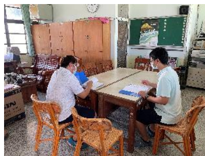
說明：討論課程內容