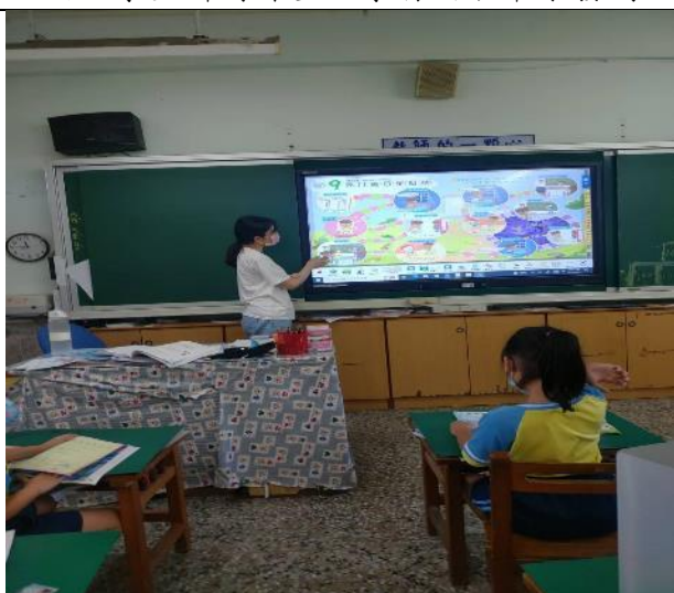
說明：教師實際舉例使學生理解。