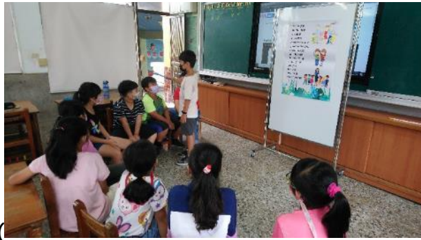
The strong wind blows