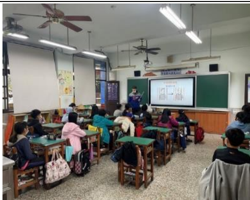
說明：老師依據影片內容提出問題，讓學生討論並回答。