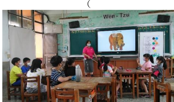
Brown bear! Brown bear! what do you see?