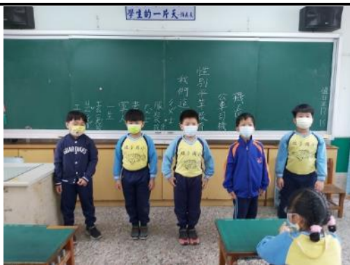
說明：分享長大後想要從事的職業