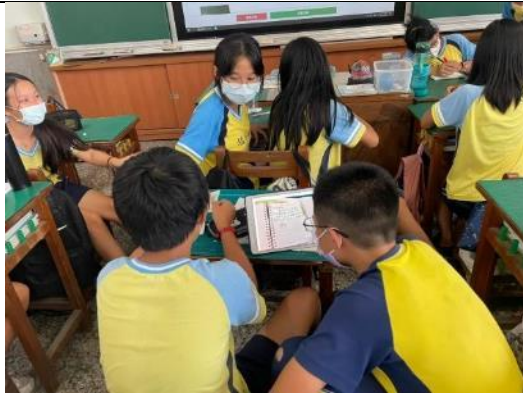
說明：學生分組討論