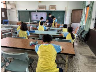
說明：學生分組實作實驗 - 虹吸現象