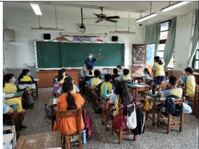
說明：教師請學生發表意見