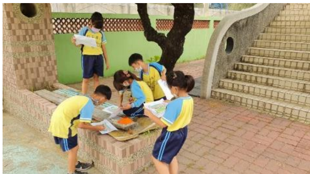
說明：探索校內自然資源