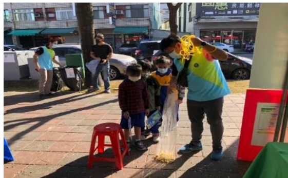
說明：結合校本課程進行社區推廣活動