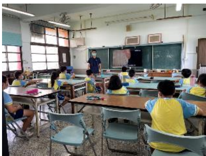
說明：讓學生認識連通管原理