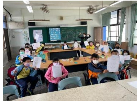
說明：製作小書成果