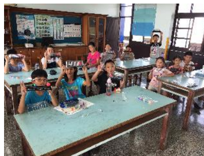
說明：讓學生動手製作月相模型