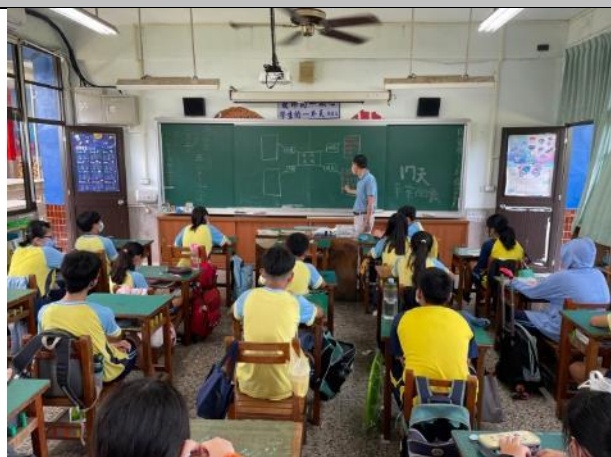
說明：利用心智圖方式整理，將全班分為四