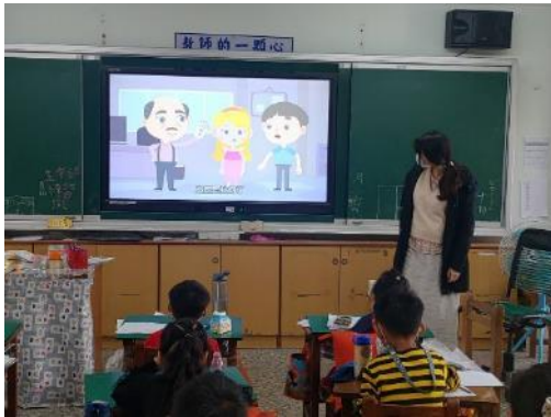
說明：以影片方式了解性侵害之狀況。