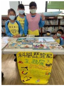
說明：分享主題展內容