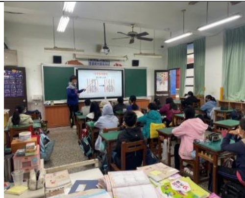
說明：由老師進行統整及講解