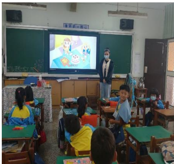
說明：利用影片觀賞方式促進孩童的學習表現。