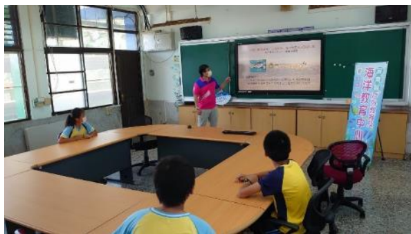
說明：海洋教育巡迴到校活動