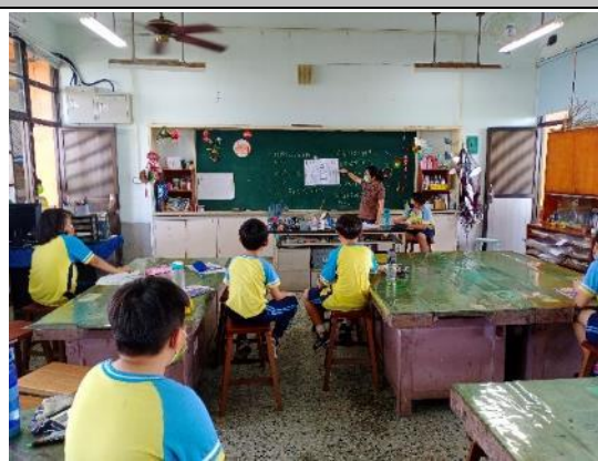
說明：藝文老師示範說明