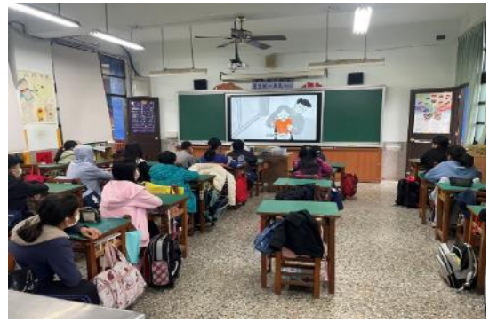
說明：以影片方式介紹及觀看性侵害及性騷擾之重點。