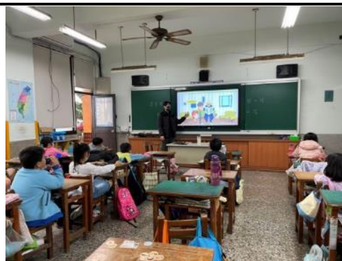
說明：透過影片引導性別平等觀念