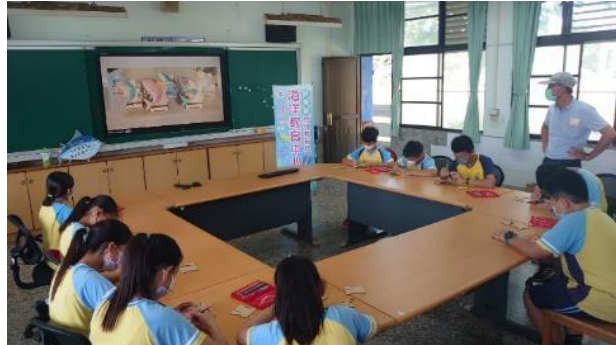
說明：海洋教育巡迴到校活動