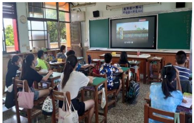
說明：教師讓學生觀看地下水相關影片