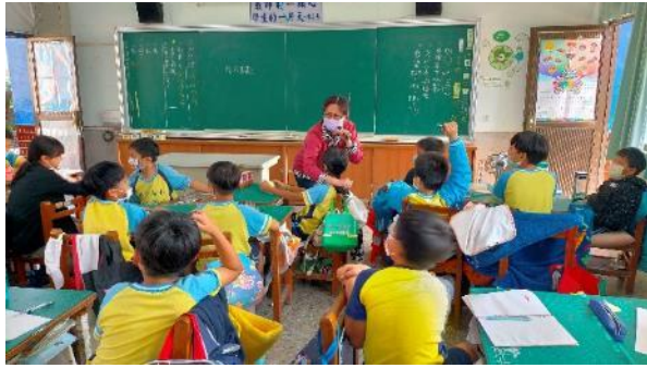
說明：教師示範性騷擾可能的行為