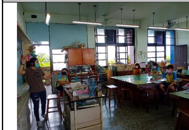
說明：藝文老師示範說明