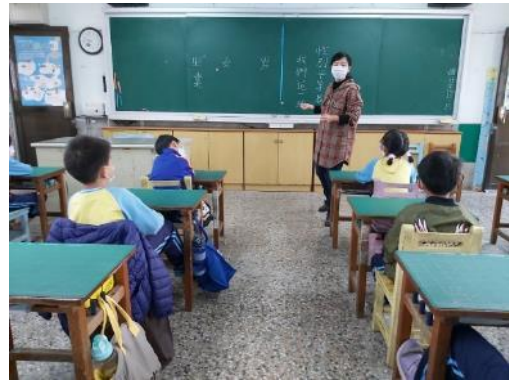
說明：討論社會新聞中的性侵害