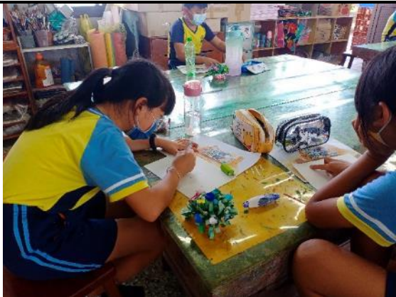
說明：作品模擬練習