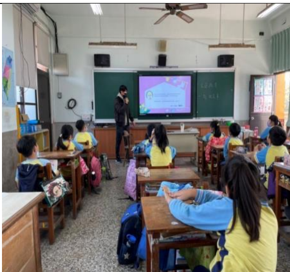
說明：說明家庭教育-家事的重要