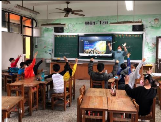
Let's listen and say