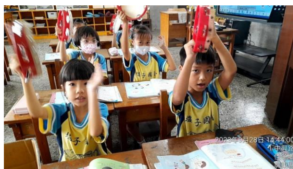
說明：學生練習節拍