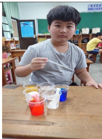
說明：學生將色素滴進水中，並觀察毛細現象