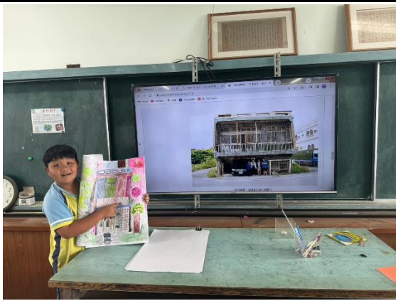
說明：學生畫出在參訪時看到的景象