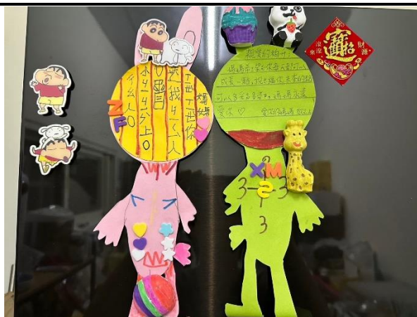
融入生活教育，以短語與家人對話