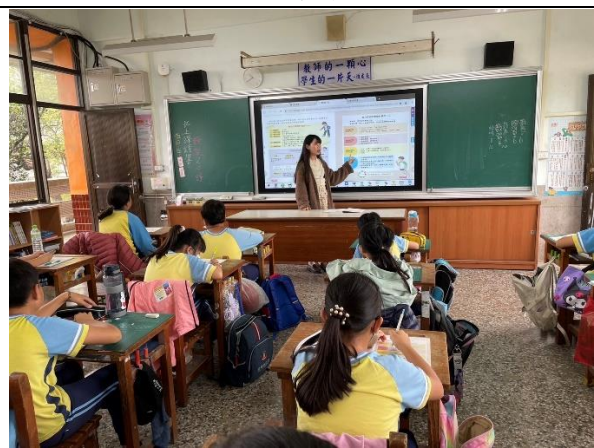
說明：教師請學生寫下自己的經驗。