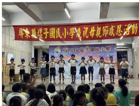
說明：粉墨登場上台表演