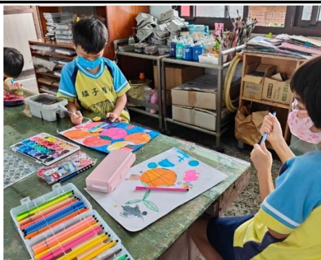
說明：小朋友創作屬於自己的作品