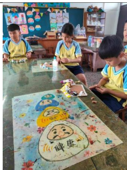
說明：用黏土創作獨一無二的相框