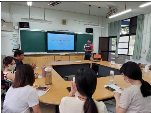
說明：教師班級閱讀推動成果分享