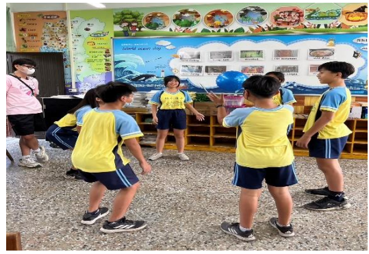
說明：學生透過闖關活動展現成果