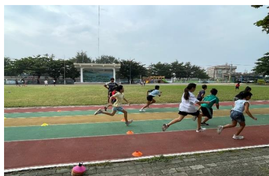
說明：學生進行接棒練習