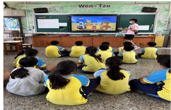
說明：教師讓學生觀看影片加深觀念