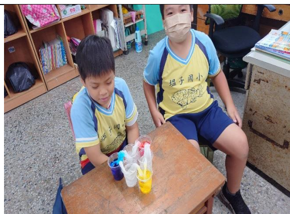
說明：學生等待並觀察毛細現象