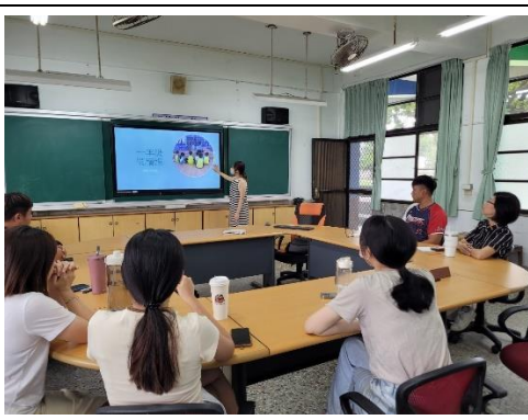
說明：教師班級閱讀推動成果分享