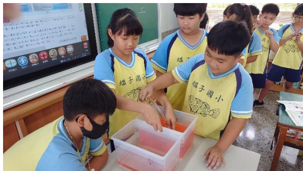
說明：學生體驗虹吸現象