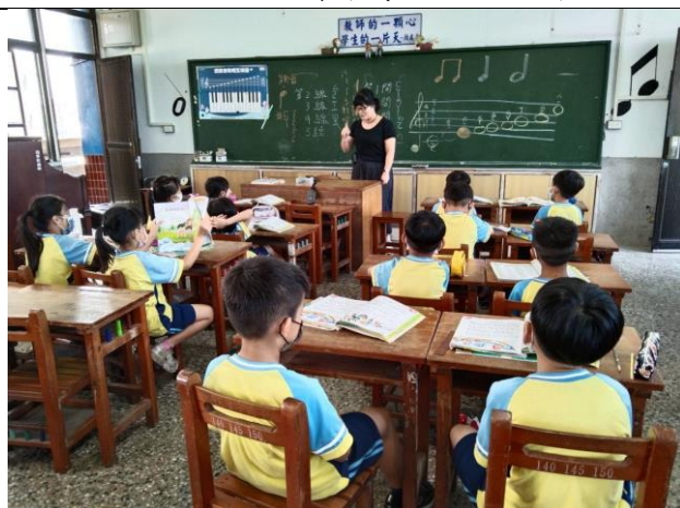
說明：熟悉音階位置