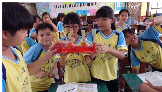
說明：學生實作聯通管原理是否可達到水平