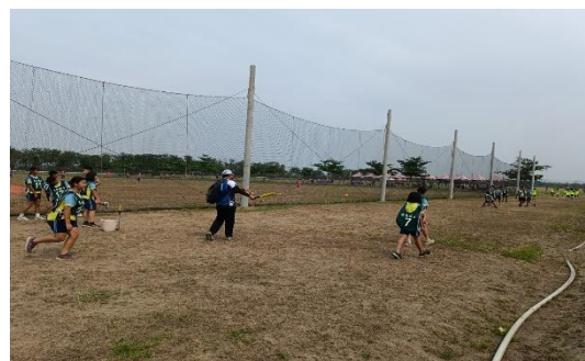
說明：六年級學生樂樂棒球賽前守備練習