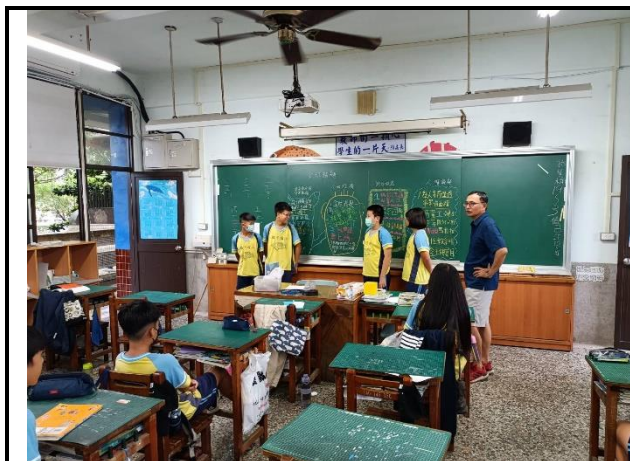
說明：各組學生實作情形，老師從旁引導。