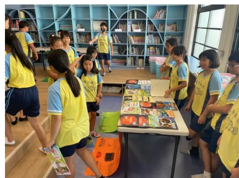
說明：六年級畢業書展