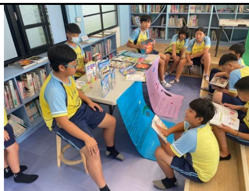
說明：學生以闖關活動展現學習成果