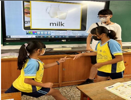
說明：學生透過闖關活動展現成果