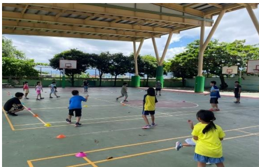
說明：學生進行飛盤傳接