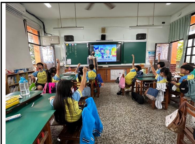
說明：教師請學生發表學習的經驗。