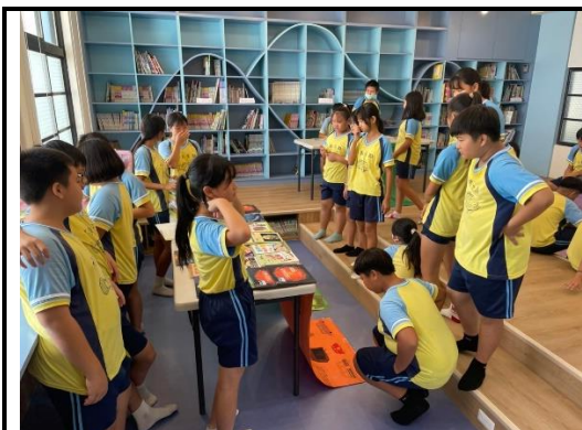
說明：學生以闖關活動展現學習成果