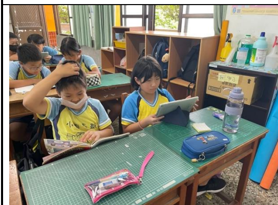
說明：學生運用平板進行線上測驗