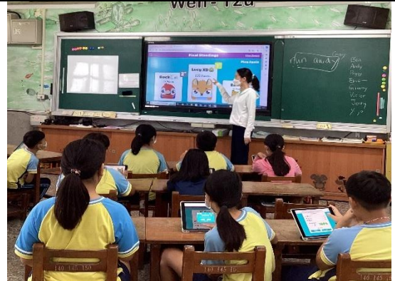
說明：教師運用多媒體教學