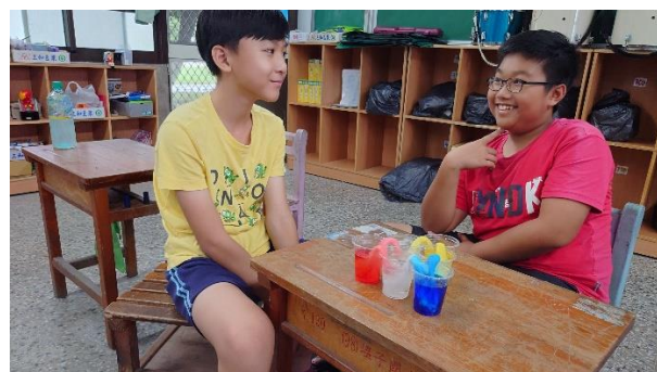
說明：學生等待並觀察毛細現象