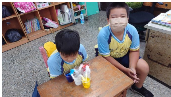
說明：學生等待並觀察毛細現象