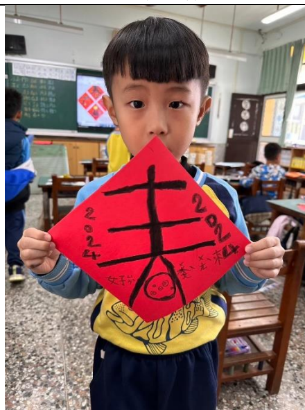
節慶結合製作春聯