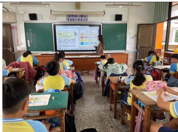
說明：教師以電子書輔助說明課程內容。