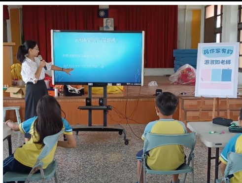
說明：與作家有約系列講座