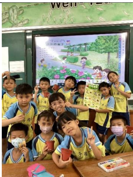
說明：觀察四季豆的生長