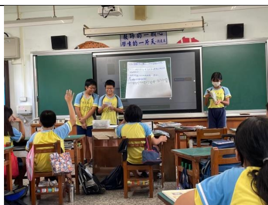
說明：學生上台分享學習歷程