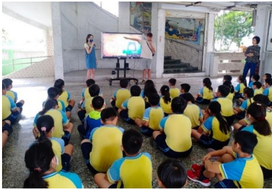
說明：教師讓學生觀看影片加深觀念