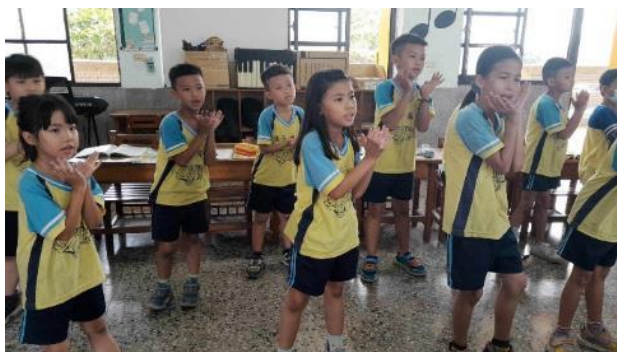
說明：唱歌跳舞練節奏