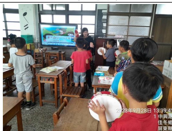
說明：學習用鈴鼓拍出節拍