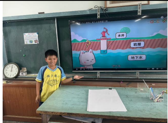
說明：學生在分組討論後，上台向同學說明造成地層下陷景觀之成因