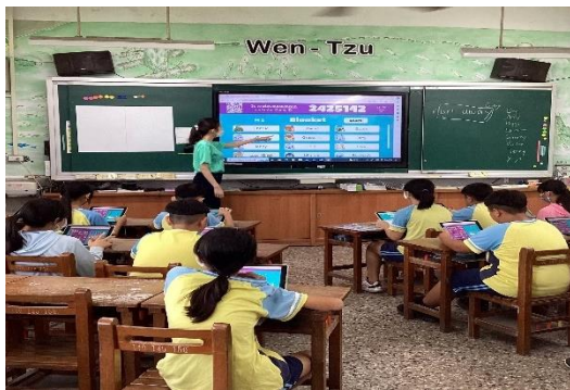
說明：教師運用多媒體教學