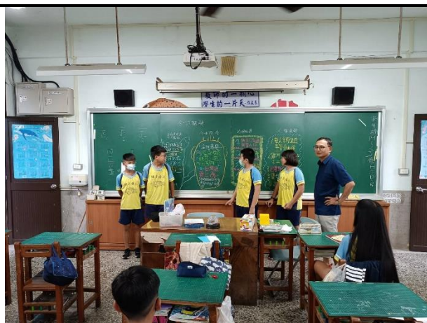
說明：各組學生實作情形，老師從旁引導。