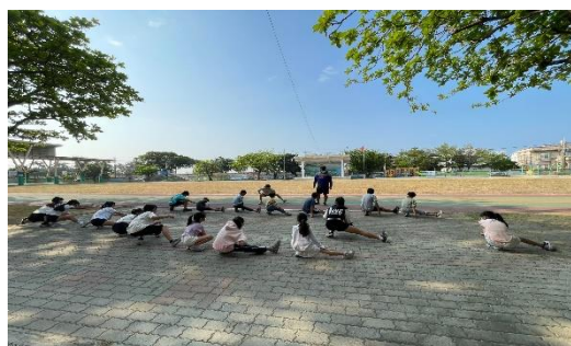
說明：體育股長進行暖身活動