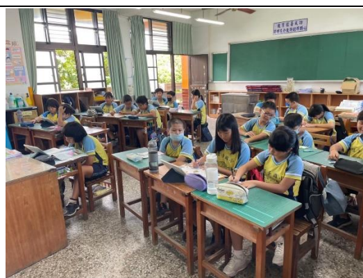
說明：學生運用平板進行線上測驗