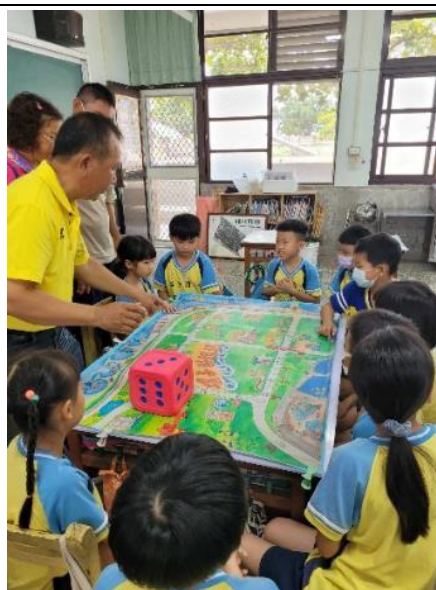
說明：玩大富翁來認識家鄉