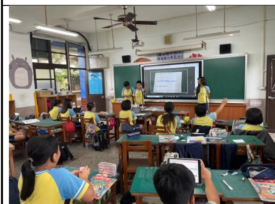
說明：學生上台分享學習歷程