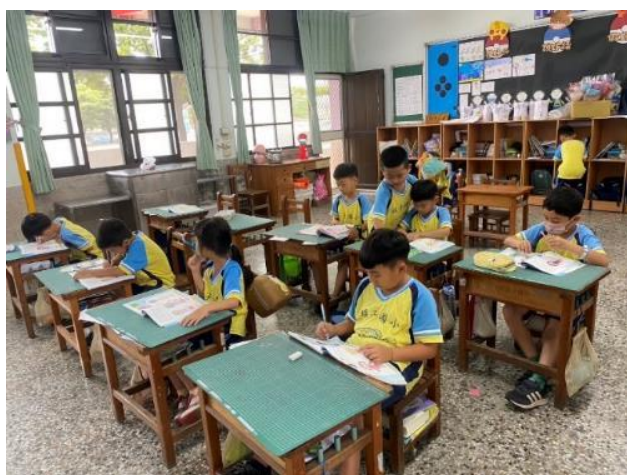
說明：記錄在校園觀察到的景象