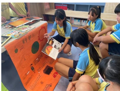
說明：六年級畢業書展