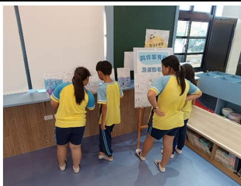
說明：與作家有約主題書展