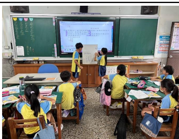
說明：小組討論後分享學習時遇到的困難。