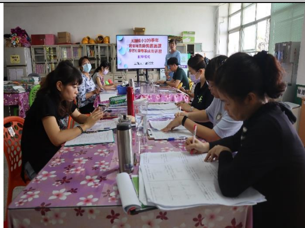
說明：觀備議課研討