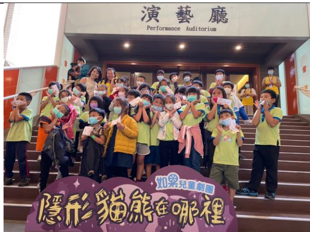
說明：486 團購-遊學-如果兒童劇團