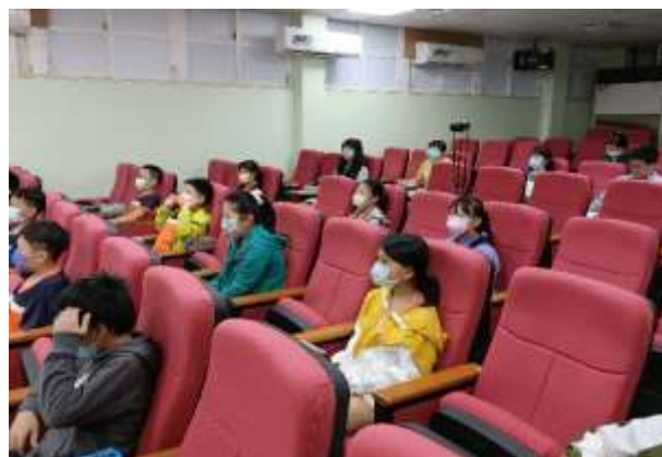
說明：保持防疫距離