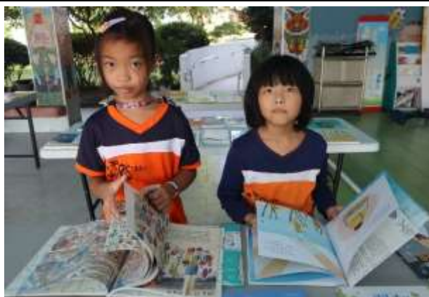
說明：天下雜誌新書