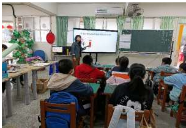
說明：介紹原理原則