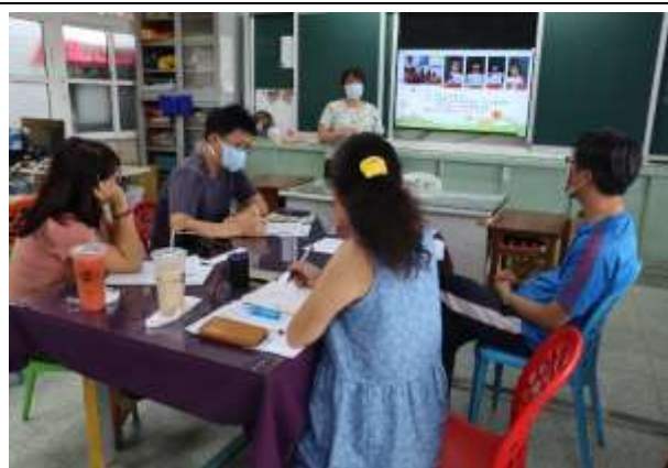
說明：各班閱讀成果分享

(請針對整體課程實踐之省思/課程設計與教學策略之策進方案/未來專業成長規劃與需求……等面向，具體描述，給予回饋)