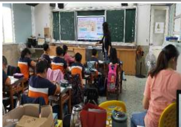
說明：做最後總複習

(請針對整體課程實踐之省思/課程設計與教學策略之策進方案/未來專業成長規劃與需求等面向，具體描述，給予回饋)