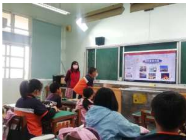
說明：學生操作增加印象

(請針對整體課程實踐之省思/課程設計與教學策略之策進方案/未來專業成長規劃與需求等面向，具體描述，給予回饋)