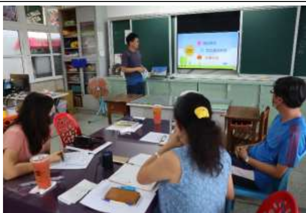
說明：各班閱讀成果分享