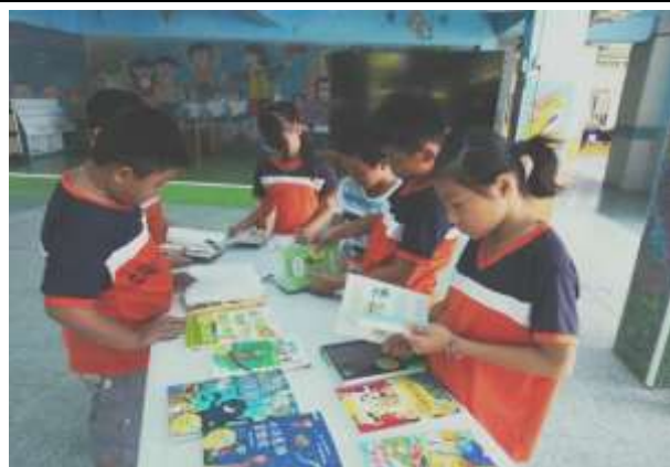
說明：天下雜誌新書