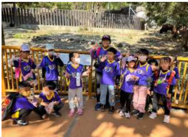
說明：高雄壽山動物園健走與動物對話