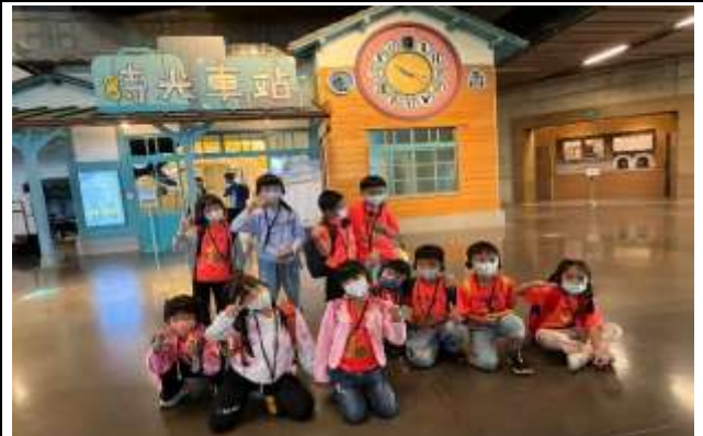
說明：搭乘時光車站來一趟穿越時光之旅