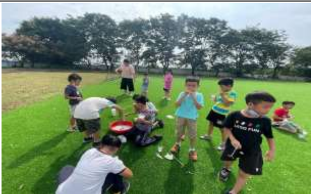
說明：讓學生走出教室，嘗試不同工具吹泡泡。