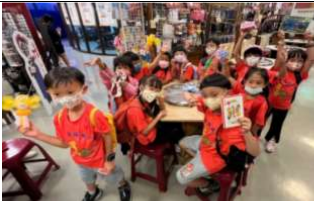
說明：博物館內各種童玩體驗樂無窮