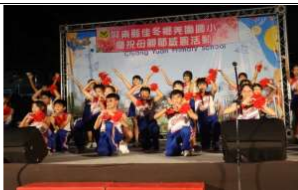
說明：母親節晚會表演

(請針對整體課程實踐之省思/課程設計與教學策略之策進方案/未來專業成長規劃與需求……等面向，具體描述，給予回饋)