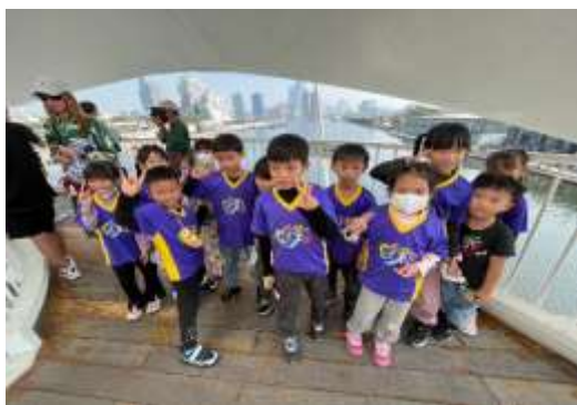
說明：駁二藝術特區參訪(常設展)