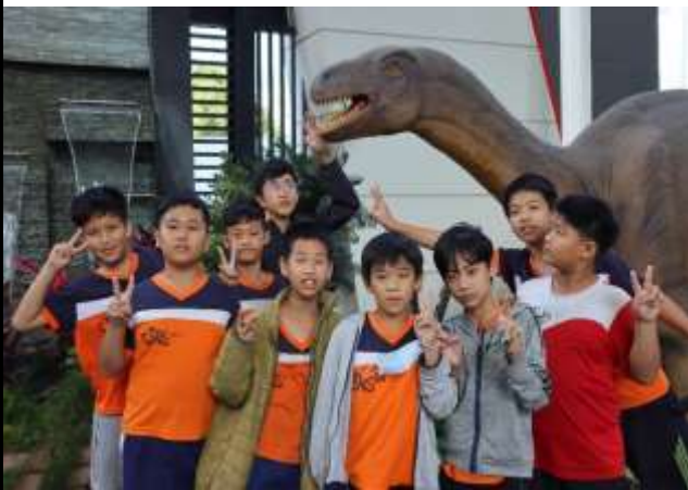
說明：高美館參觀之恐龍展