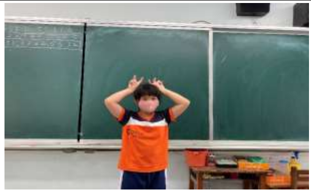
說明：學生表演最喜歡的動物讓大家猜。