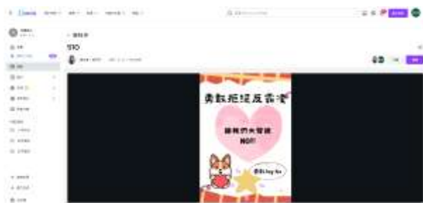
說明：學生使用 canva 製作反霸凌海報。