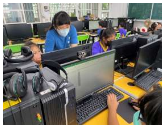
說明：學生學習 excel 相關應用。