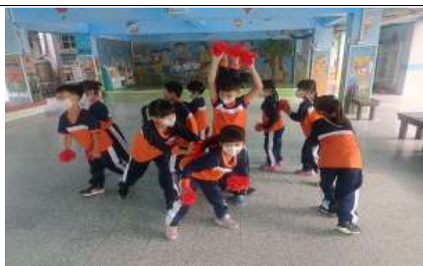
說明：準備運動會表演