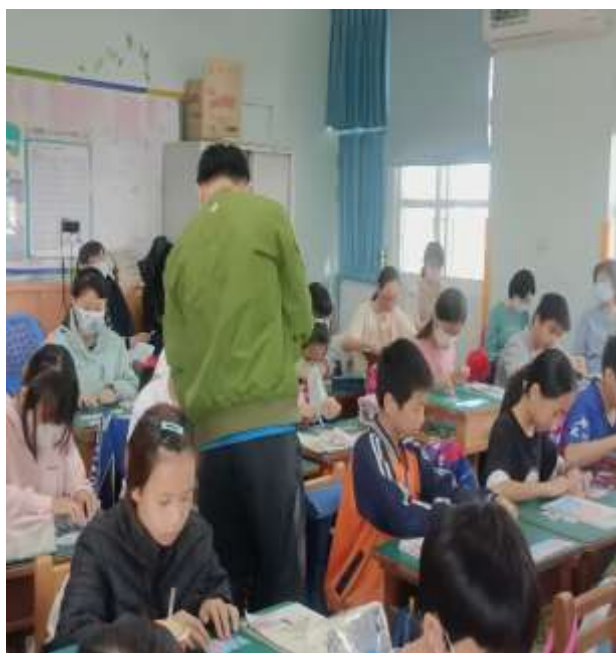
說明：巡視行間觀看教具操作情形