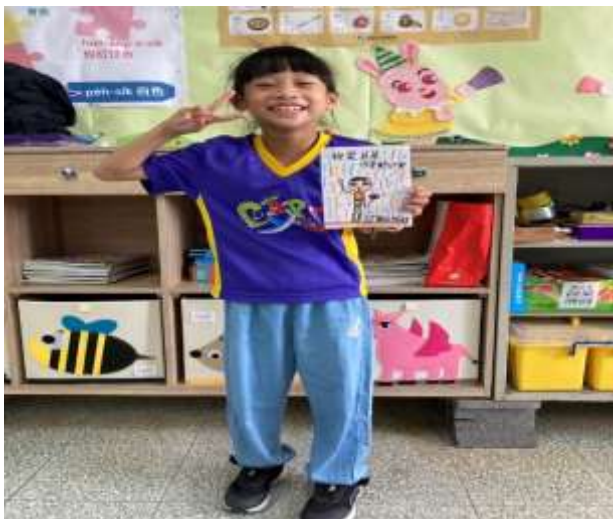
說明：學生自製故事小書成品。