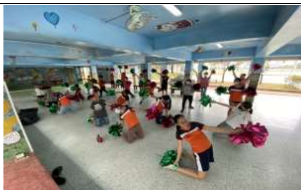
說明：準備運動會表演