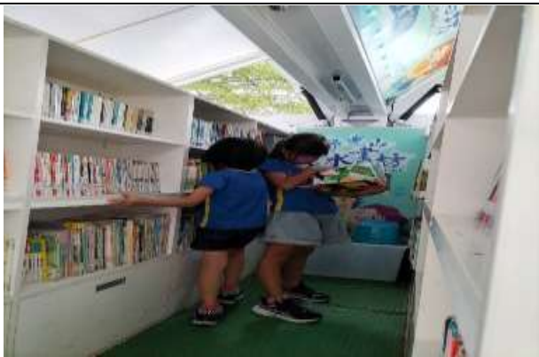
說明：雲水書車到訪