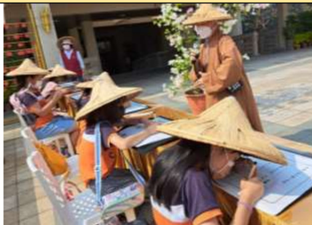
說明：學生臨摹書法字帖勸人行善字句