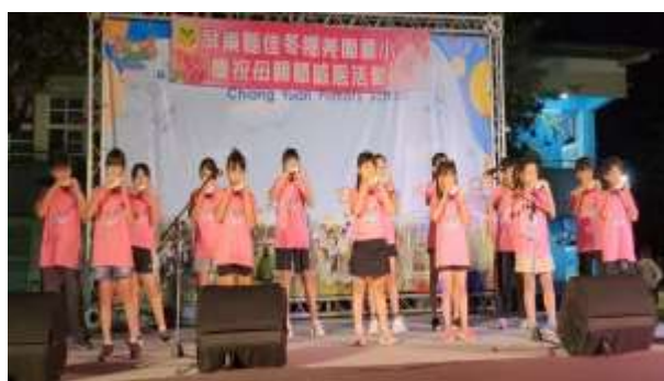
說明：母親節晚會陶笛表演

(請針對整體課程實踐之省思/課程設計與教學策略之策進方案/未來專業成長規劃與需求……等面向，具體描述，給予回饋)