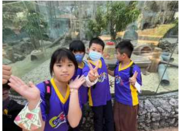
說明：動物園各個區域生態與動物特性