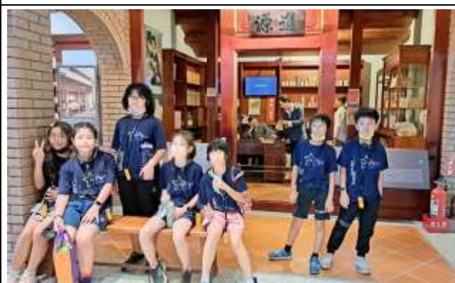
說明：日據時期各種生活商行