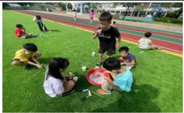
說明：讓學生走出教室，嘗試不同工具吹泡泡。