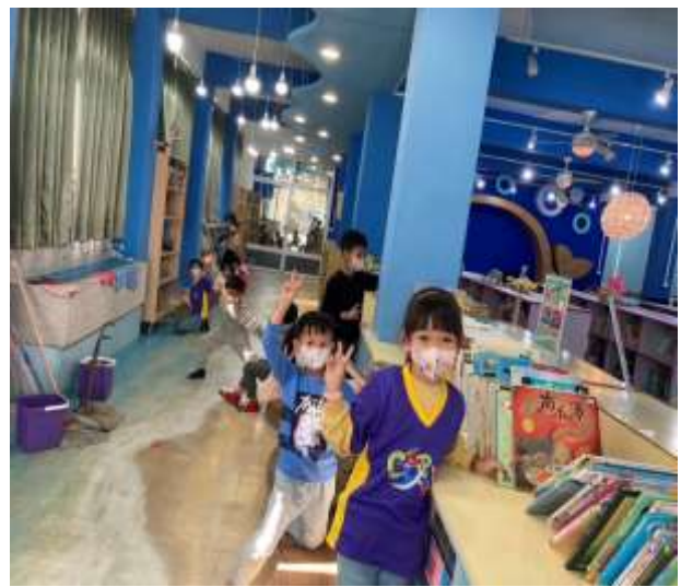
說明：學生協助整理並排列書籍。