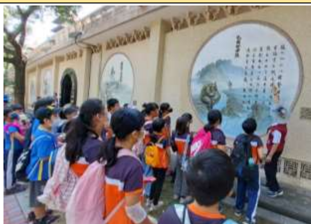
說明：志工講解教人行善的壁畫故事引導學生感受及學習