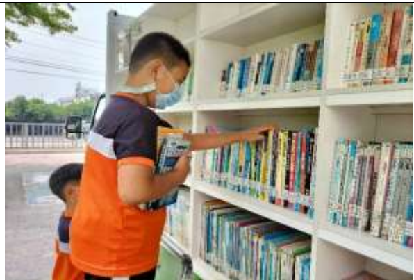
說明：雲水書車到訪