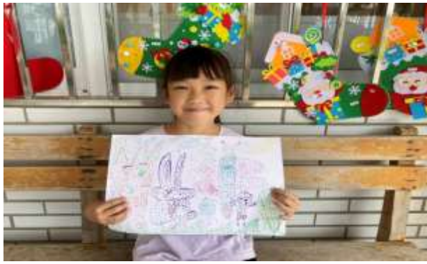
說明：學生點點畫成品。