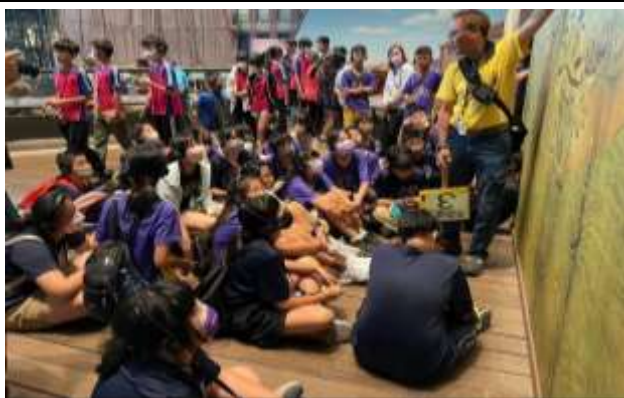
說明：導遊說明台灣的歷史沿革及領土開拓