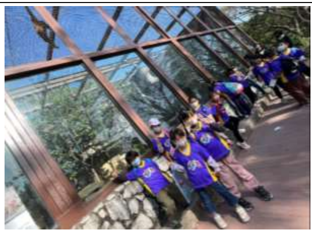
說明：講解不同生物的棲息環境