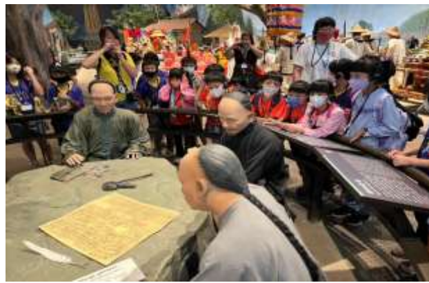
說明：當時台灣的交易及生活記事方式