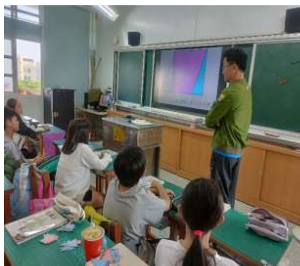
說明：回憶舊經驗教學