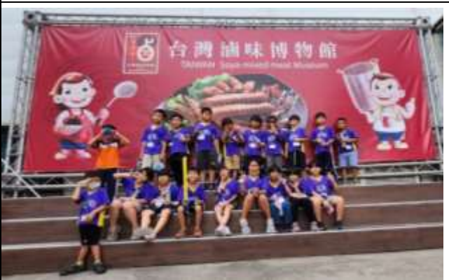
說明：博物館體驗生活樂趣及生活素養