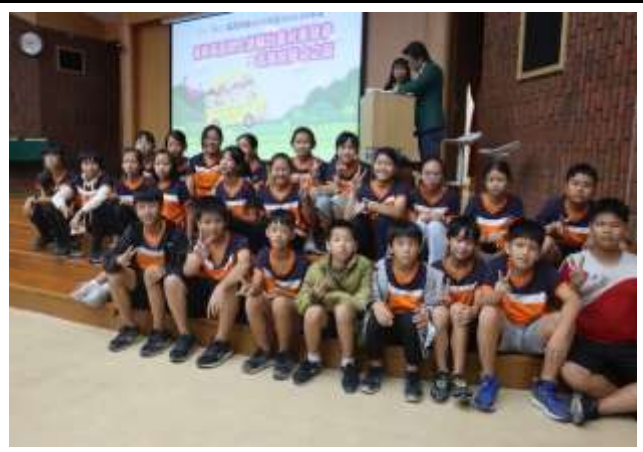
說明：英語成果與高美館文化之旅