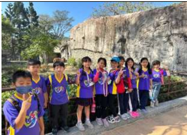
說明：師生探訪不同類別動物區