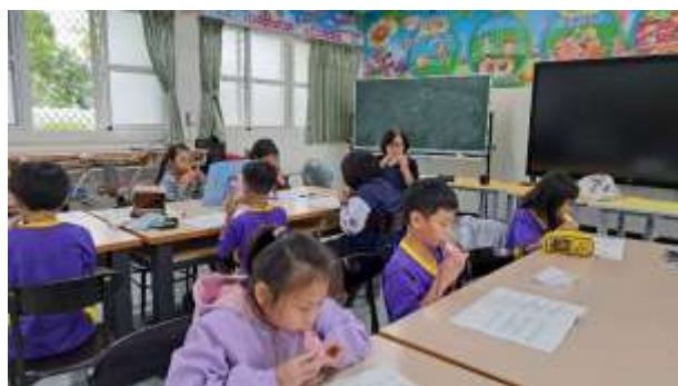
說明：老師與學生合奏陶笛