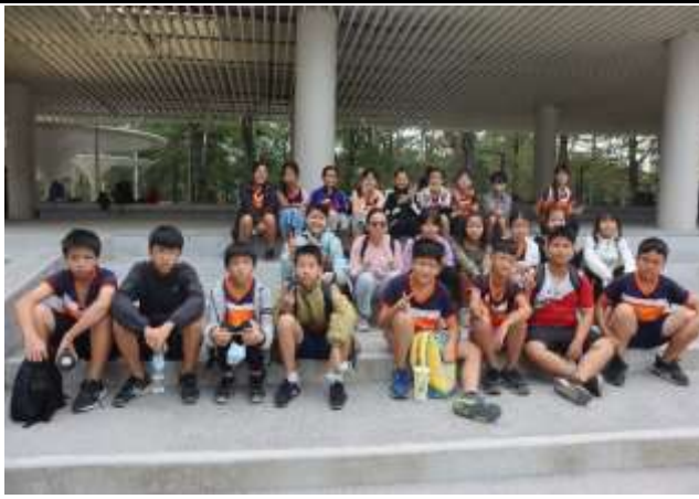
說明：高美館教學體驗之旅