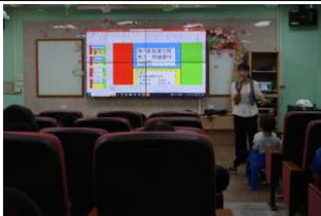
說明：晨間宣導—性侵害