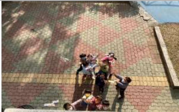
說明：學生創作完紙蜻蜓，立刻讓他們試玩。