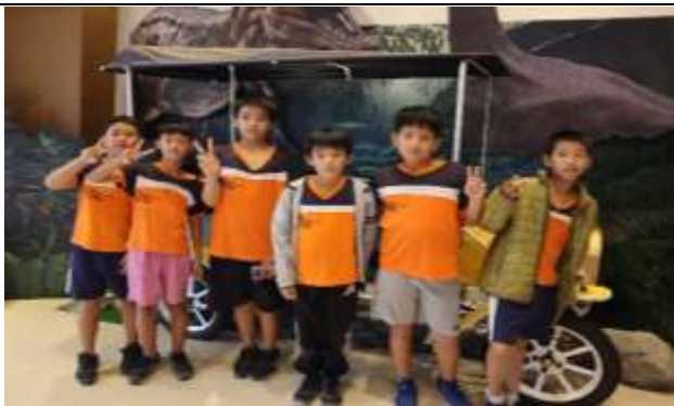
說明：高美館參觀之恐龍展