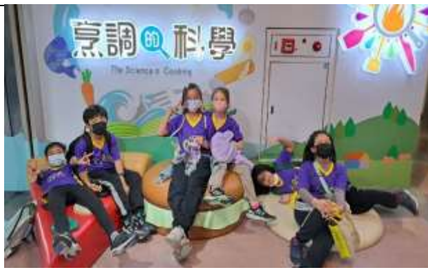
說明：與機器人近距離接觸～驚呼連連