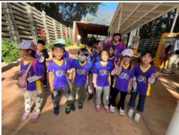
說明：說明及遵守參訪動物園禮儀