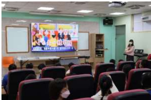
說明：生活知能課程—家庭教育宣導