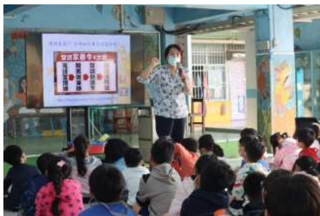
說明：生活知能課程—家庭暴力防治宣導