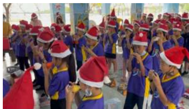
說明：聖誕活動陶笛表演