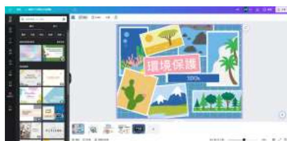
說明：學生使用 canva 製作其他課程簡報。