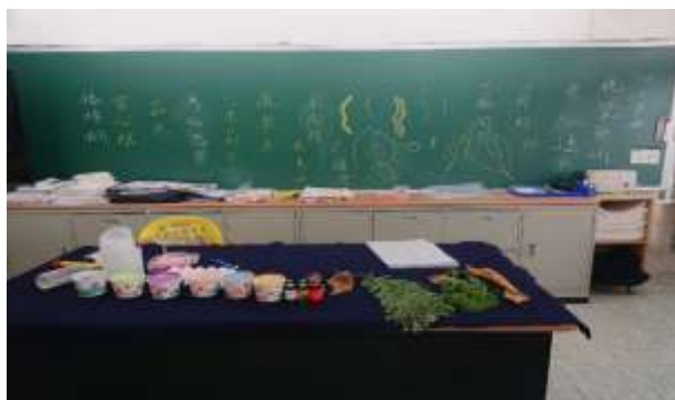
說明：介紹創作素材與理念。