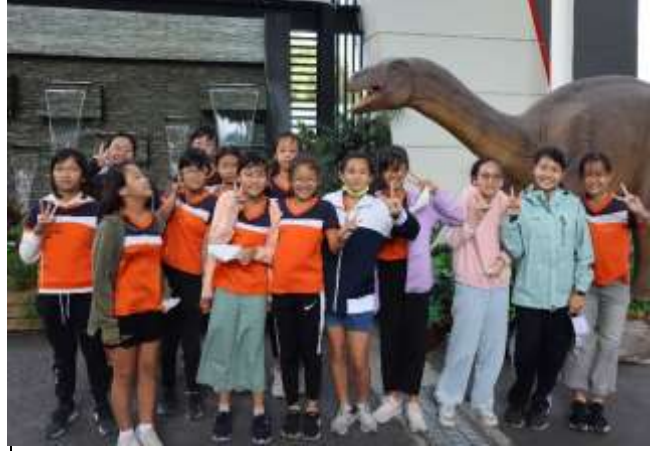
說明：高美館參觀之恐龍展