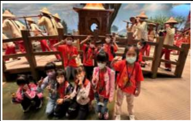
說明：栩栩如生的廟會景象結合生活意象