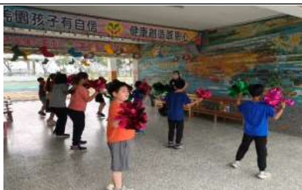
說明：準備母親節晚會表演