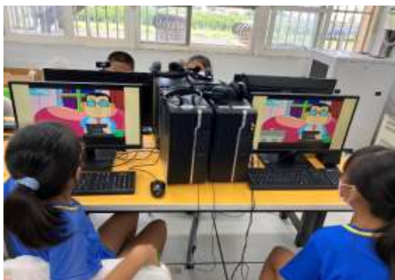
說明：學生觀看資訊安全動畫。