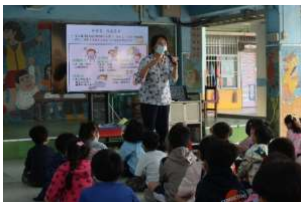
說明：生活知能課程—家庭暴力防治宣導