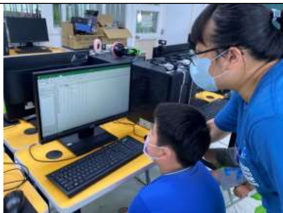
說明：學生學習 excel 相關應用。