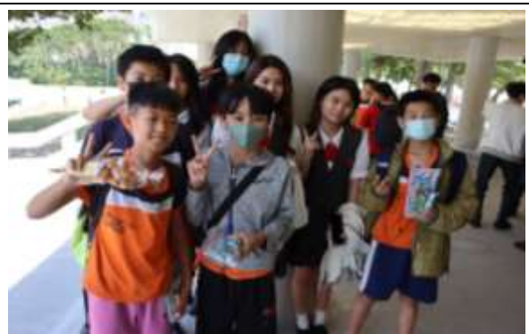
說明：英語大小學伴高美館參觀之旅