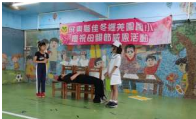
說明：學生閩南語短劇表演-孝順的故事