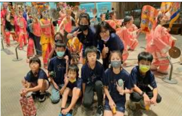
說明：博物館內真人比例的廟會景象