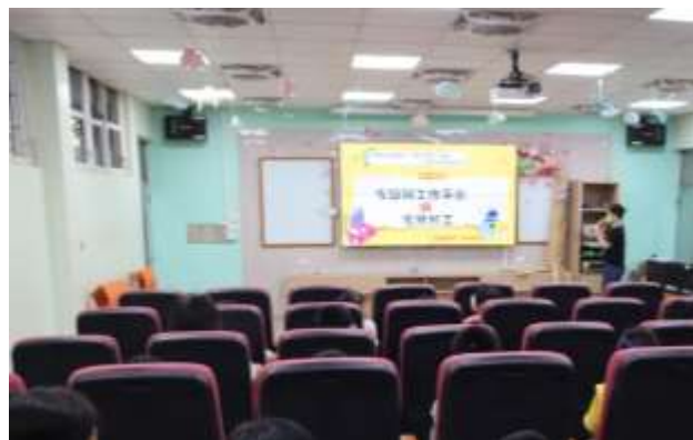
說明：晨間宣導—家庭