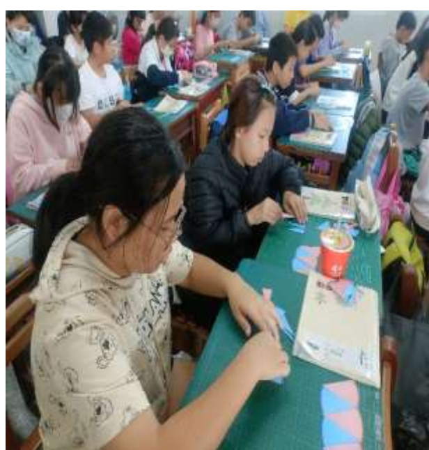
說明：學生實際教具操作