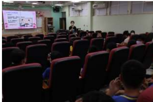
說明：生活知能課程—家庭教育宣導