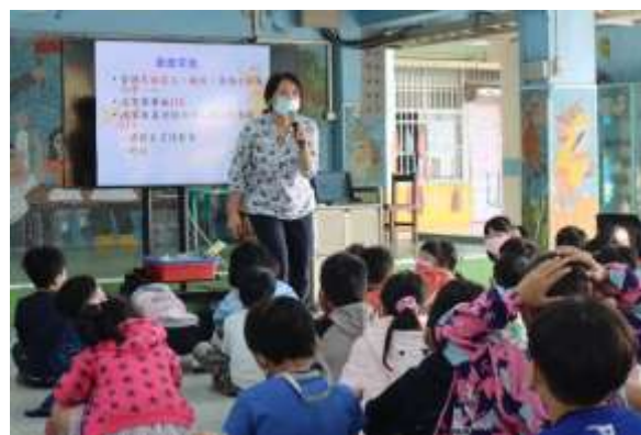
說明：生活知能課程—家庭暴力防治宣導