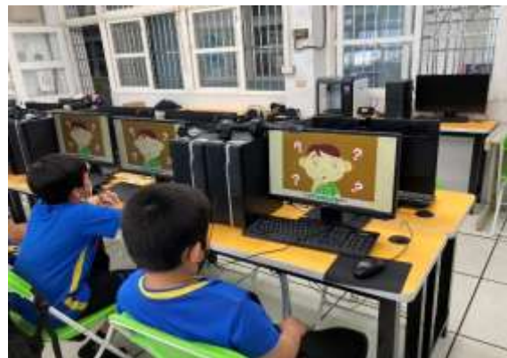
說明：學生觀看資訊安全動畫。