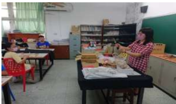
說明：介紹創作素材與理念。