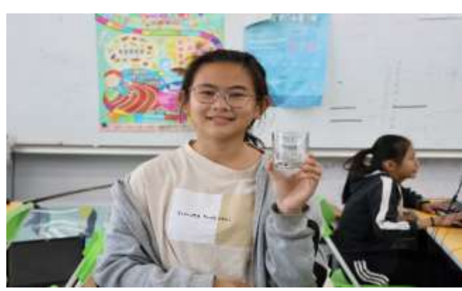
說明：雷雕成品-玻璃杯。