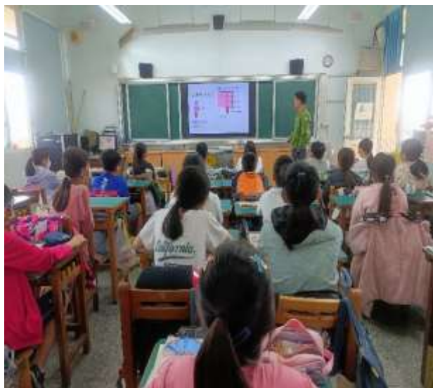
說明：回憶舊經驗教學