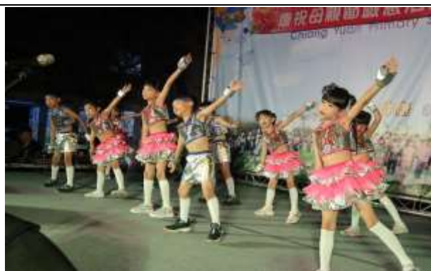
說明：母親節晚會表演