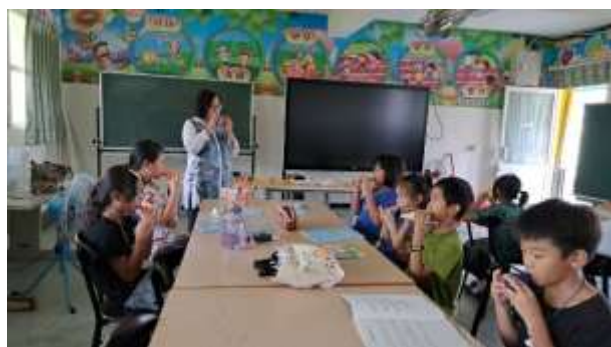
說明：老師與學生合奏陶笛