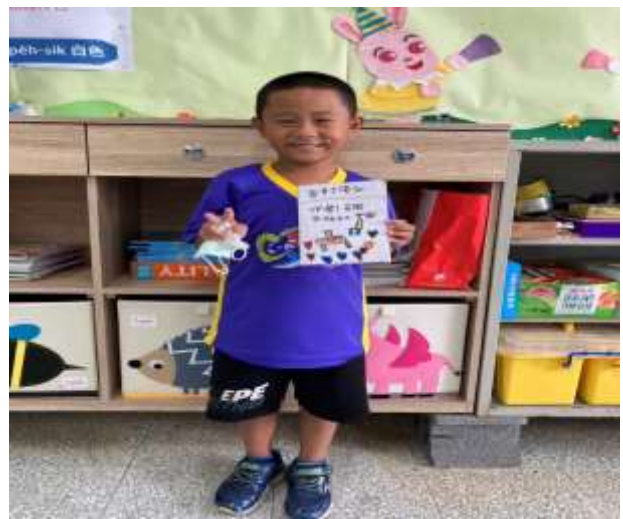
說明：學生自製故事小書成品。