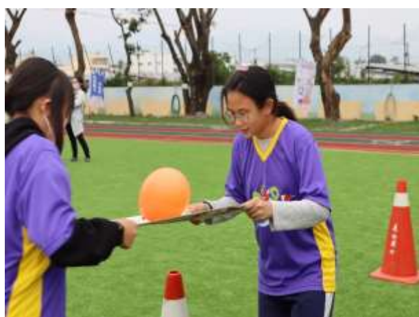
說明：同心協力體育活動。