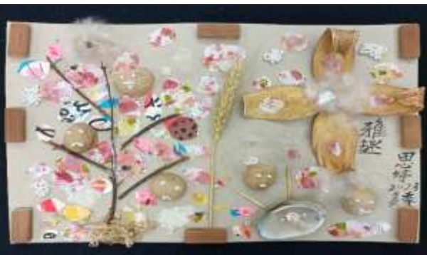
說明：享受展示成就。