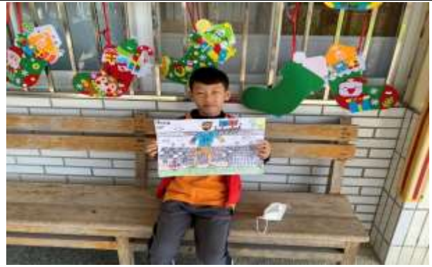
說明：學生點點畫成品。