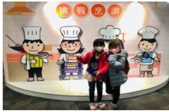
說明：機器人料理大賽