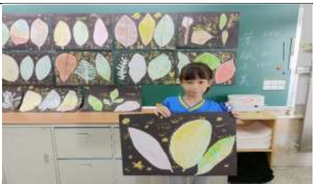
說明：享受展示成就。