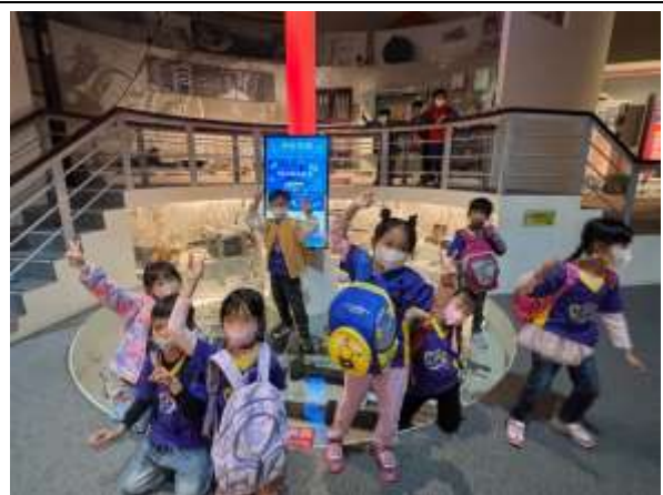
說明：科工館各種生活化機器體驗