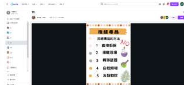
說明：學生使用 canva 製作反毒海報。