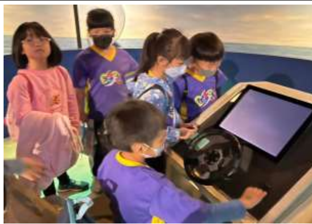
說明：機械化的設計與體驗，闖關增進學習興趣