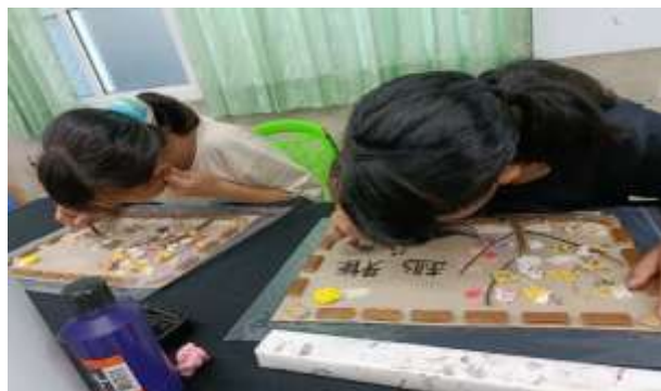
說明：環保創作~加入佳句及落款