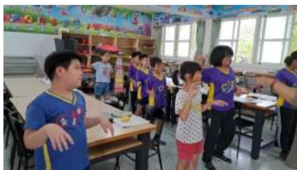
說明：陶笛吹奏加上帶動唱課程教學