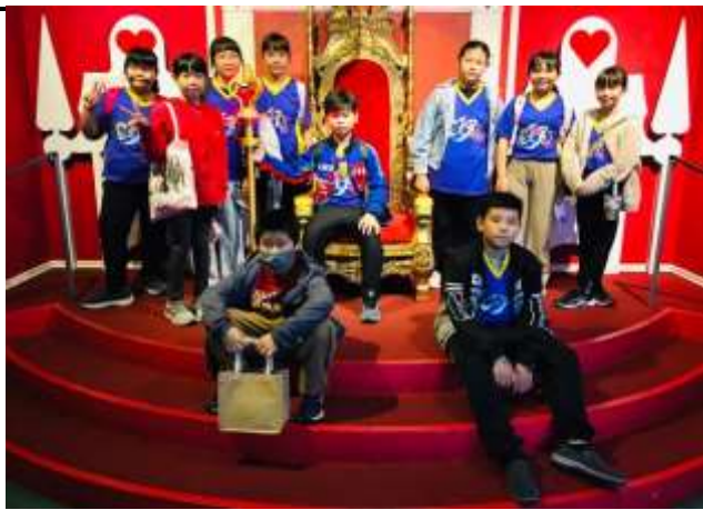
說明：機器人時代及 AI 的先備知識