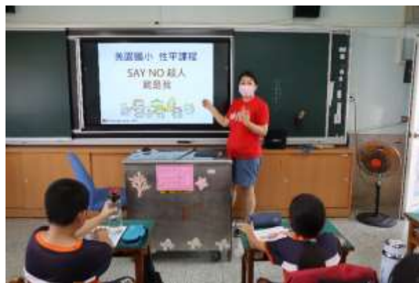
說明：課堂教學—性平