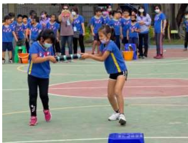
說明：同心協力體育活動。