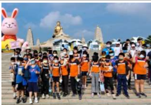
說明：佛光山教學體驗