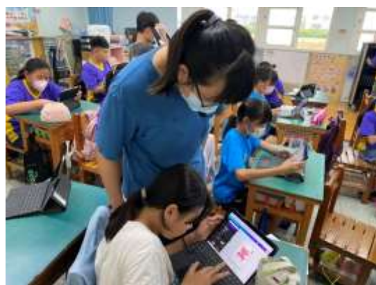
說明：老師觀察學生使用 canva 的狀況。