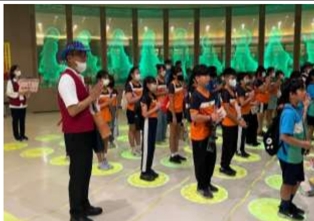
說明：禮佛、拜佛及平安水後展開闖關活動