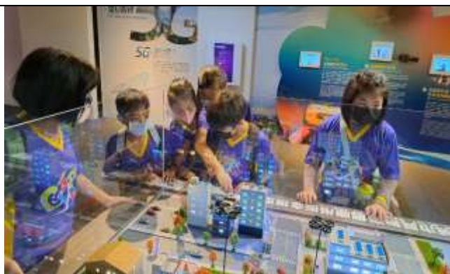
說明：動手做～讓學習變有趣