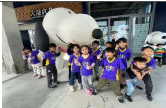
說明：駁二藝術特區參訪(常設展)