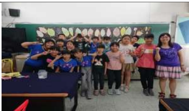
說明：享受展示成就。