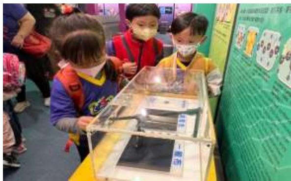
說明：生活物品的不同科學資料