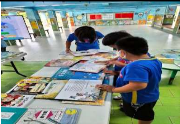
說明：天下雜誌新書展示