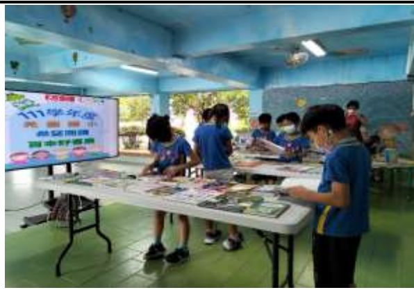
說明：天下雜誌新書展示