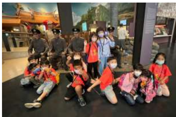
說明：日據時期的警察大人蠟像在身旁