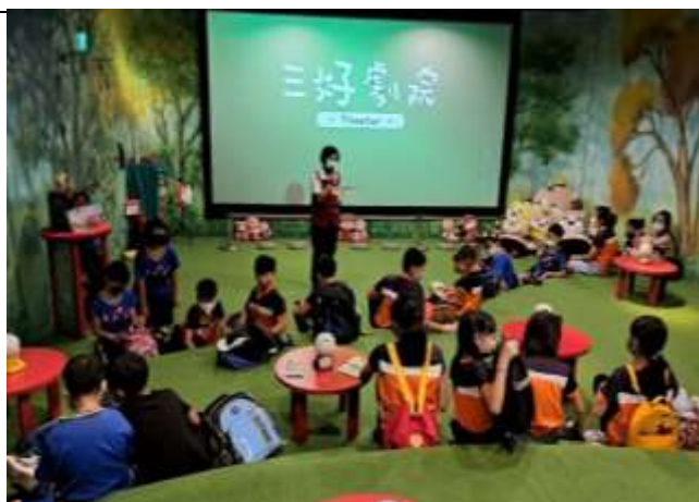
說明：佛光山「三好劇院」參訪