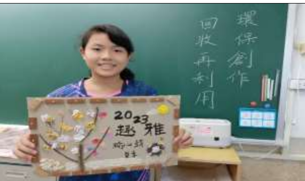
說明：享受展示成就。