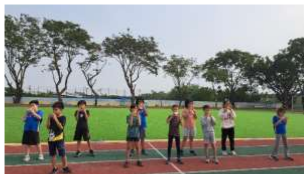
說明：預演運動會陶笛表演

(請針對整體課程實踐之省思/課程設計與教學策略之策進方案/未來專業成長規劃與需求……等面向，具體描述，給予回饋)