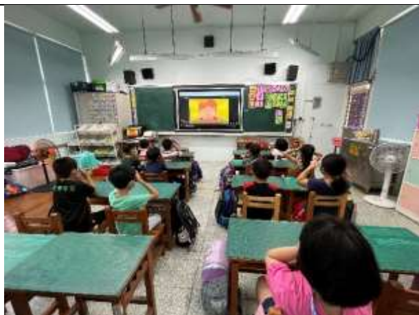
說明：視力保健課程。