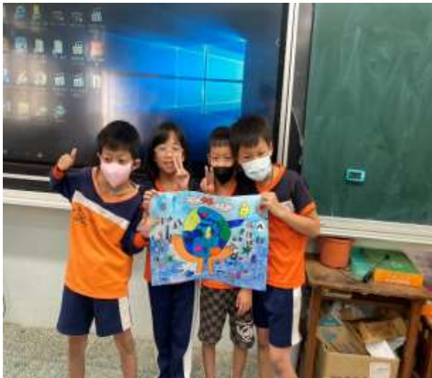
說明：環保海報成品。