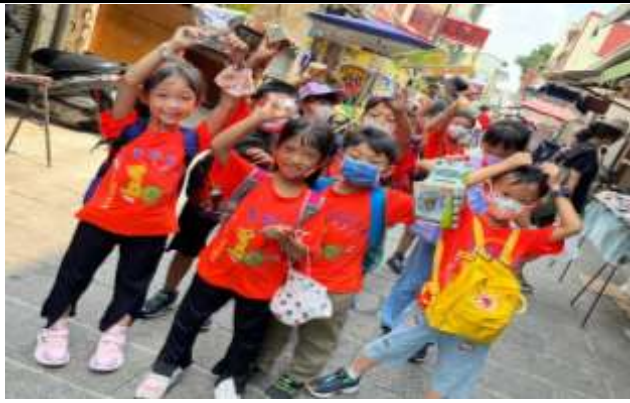
說明：老街購物體驗生活