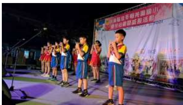
說明：母親節晚會陶笛表演