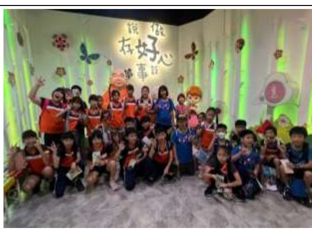
說明：佛光山「3好教學」教學體驗