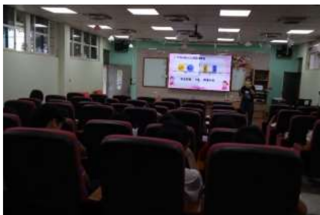
說明：生活知能課程—家庭教育宣導