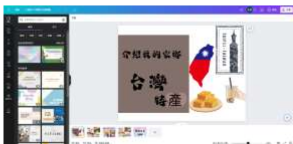
說明：學生使用 canva 製作其他課程簡報。