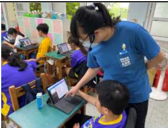
說明：老師個別指導學生使用 canva。