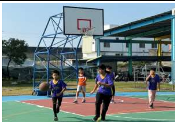
說明：體育活動課程

(請針對整體課程實踐之省思/課程設計與教學策略之策進方案/未來專業成長規劃與需求等面向，具體描述，給予回饋)