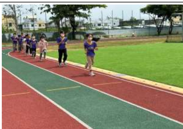
說明：體育活動課程