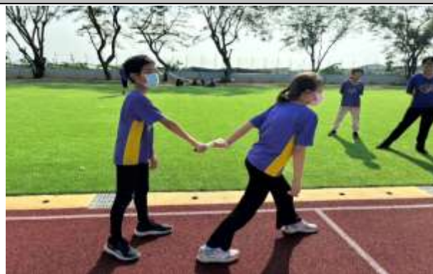
說明：體育活動課程