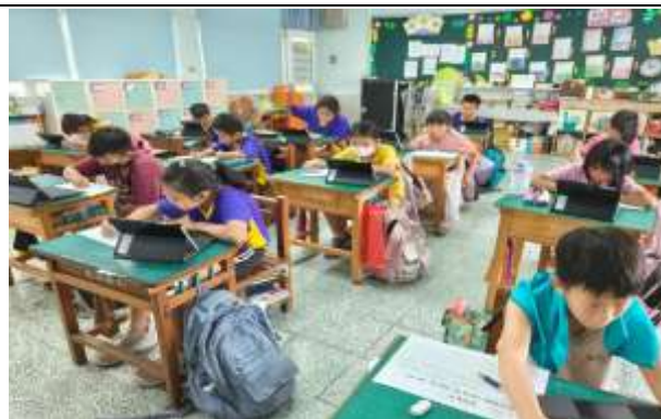
說明：使用平板完成學習單