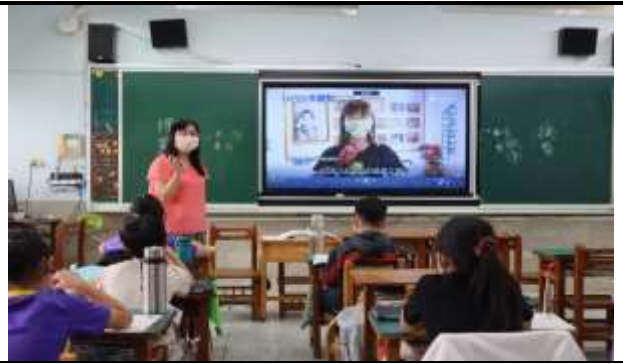
說明：老師介紹各行各業