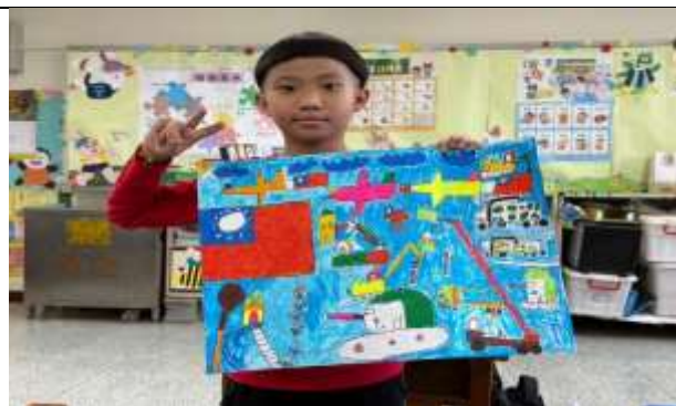
說明：國防繪畫比賽完稿

(請針對整體課程實踐之省思/課程設計與教學策略之策進方案/未來專業成長規劃與需求等面向，具體描述，給予回饋)