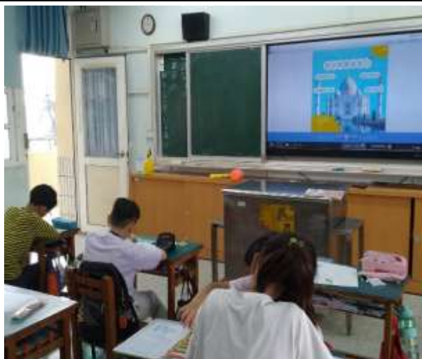
情人節認識永恆的淚珠