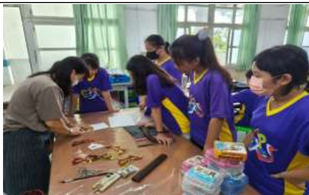
說明：老師講解如何製作