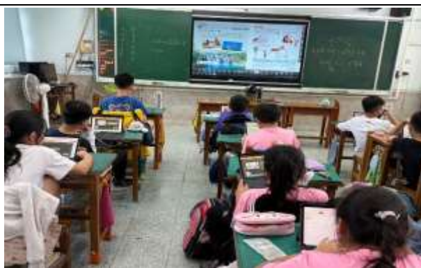
說明：利用因材網加深學習