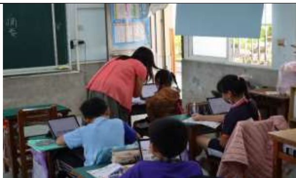
說明：結合平板教學