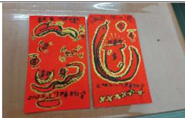
說明：蛇年紅包袋設計