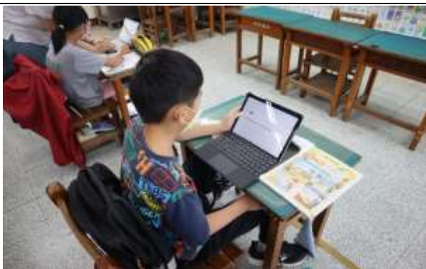
說明：使用平板找資料