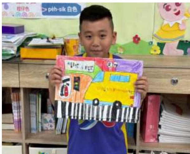
說明：投稿交通安全繪畫比賽作品