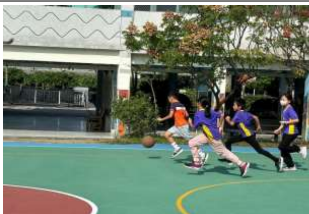
說明：體育活動課程