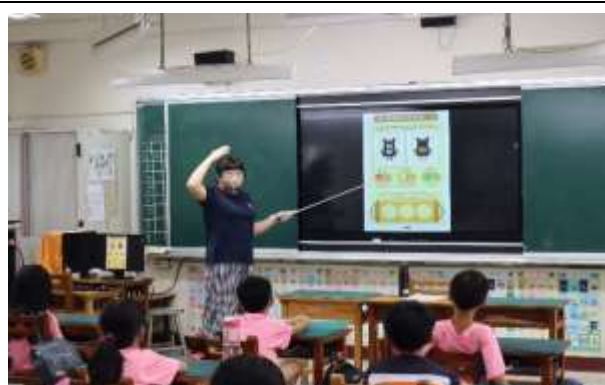
說明：課堂—身體紅綠燈