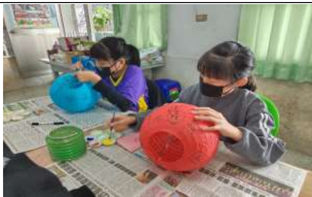
說明：燈籠彩繪設計