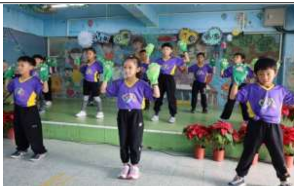
說明：運動會舞蹈表演-力與美的呈現