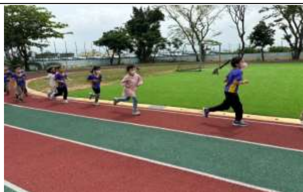
說明：體育活動課程