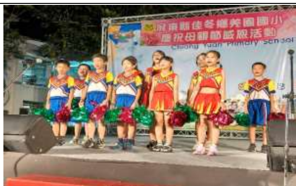
說明：母親節成果展演

(請針對整體課程實踐之省思/課程設計與教學策略之策進方案/未來專業成長規劃與需求……等面向，具體描述，給予回饋)