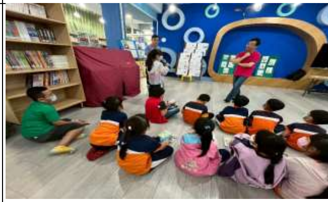
說明：作家有約—學童從書本中提問並與作家互動