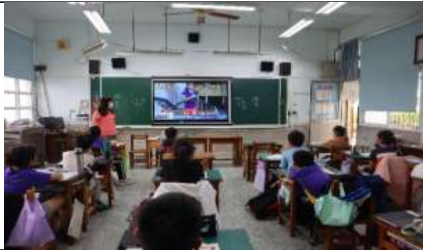
說明：老師介紹新興職業