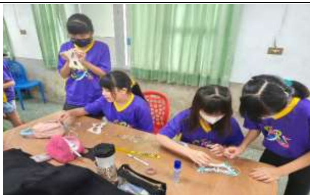
說明：創意面具製作