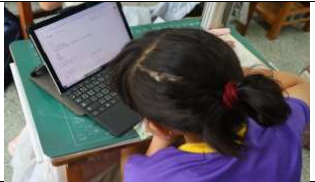
說明：用平板查詢有哪些新興職業