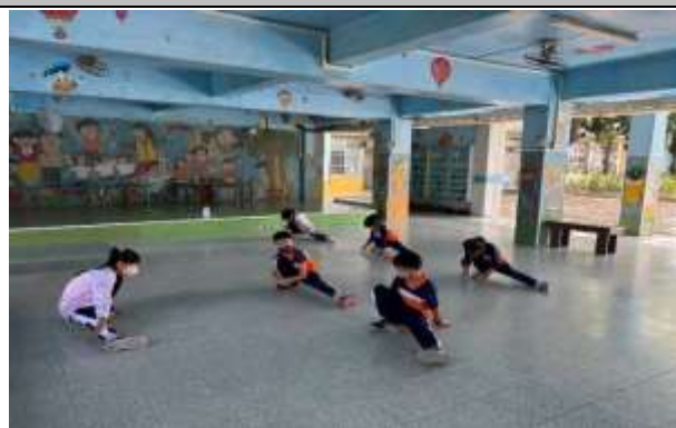
說明：體育活動課程