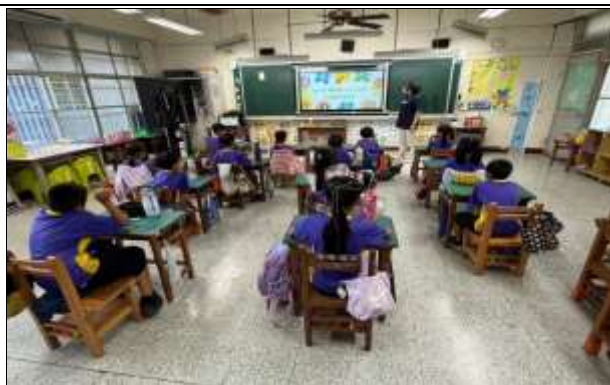
說明：課堂—學習單書寫