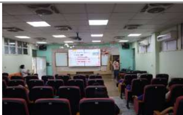
說明：家庭教育宣導