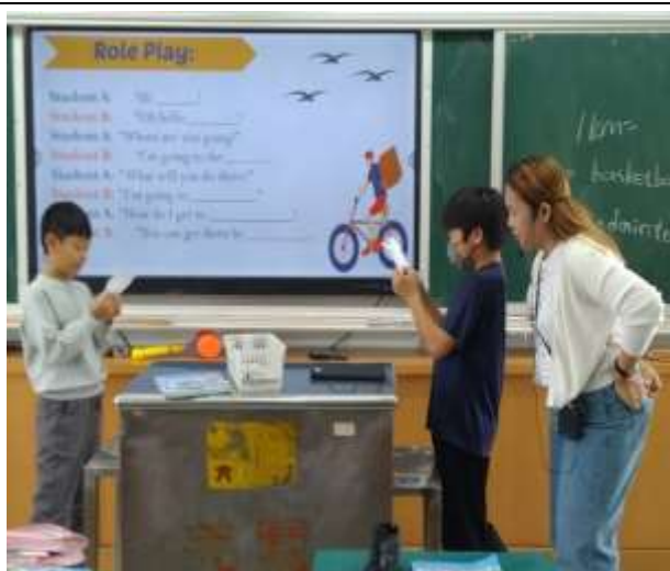
角色演練英語對話