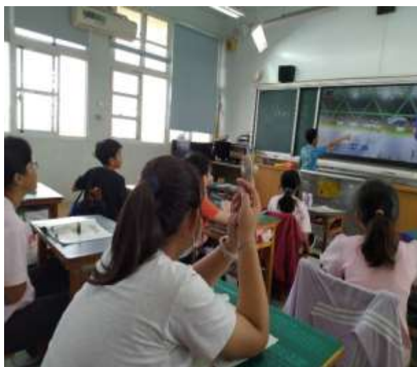
樂於分享參加直排輪比賽經歷