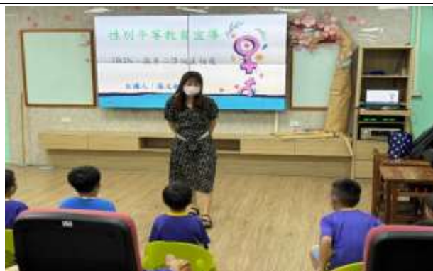
說明：晨間宣導—性別平等宣導