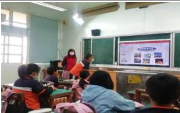
說明：讓小朋友實際操作