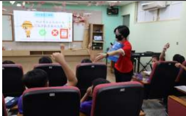
說明：校外團體入校宣導—愛滋