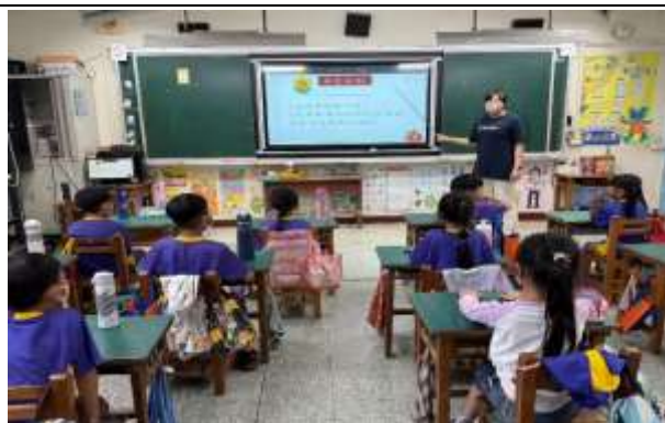
說明：課堂—學習單發表

(請針對整體課程實踐之省思/課程設計與教學策略之策進方案/未來專業成長規劃與需求……等面向，具體描述，給予回饋)