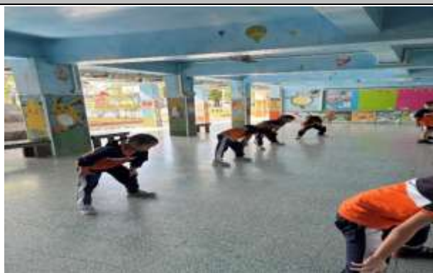
說明：體育活動課程