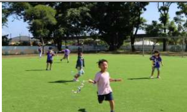
說明：戶外施放手作龍捲風玩具