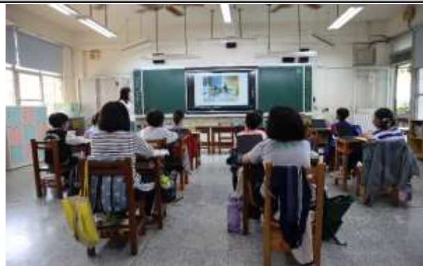
說明：透過影片加深了解