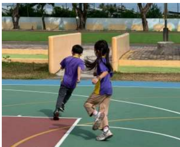
說明：學生在籃球場進行踩影子活動