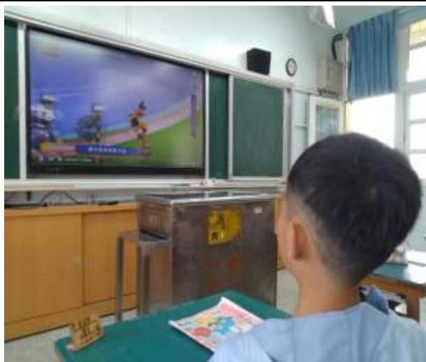
專注參與同學分享並尊重他人興趣