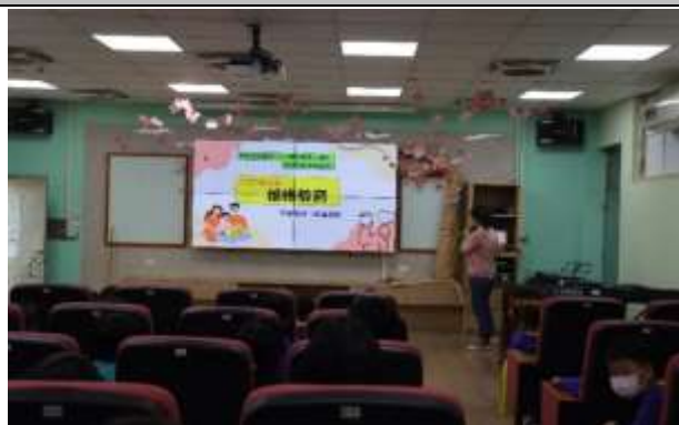
說明：家庭教育宣導