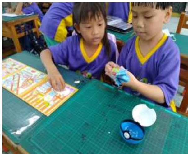
說明：學生彼此交換介紹自己的玩具。