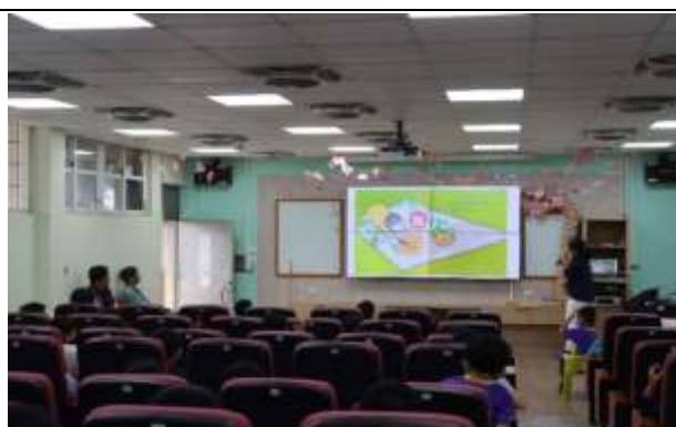
說明：失親繪本共讀