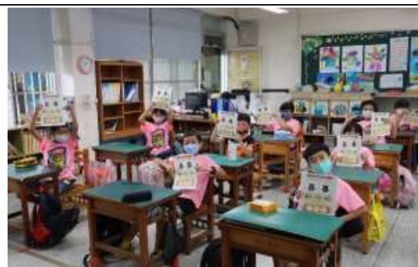
說明：課堂—學習單發表

(請針對整體課程實踐之省思/課程設計與教學策略之策進方案/未來專業成長規劃與需求……等面向，具體描述，給予回饋)