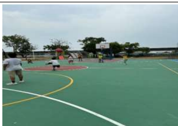
說明：體育活動課程

(請針對整體課程實踐之省思/課程設計與教學策略之策進方案/未來專業成長規劃與需求等面向，具體描述，給予回饋)