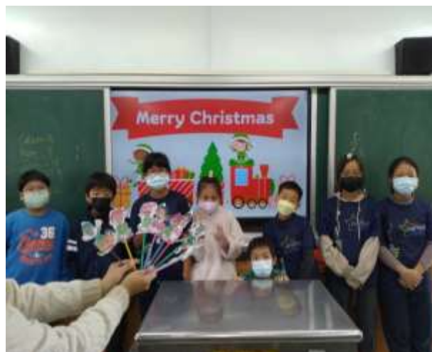
屬於我們的聖誕節