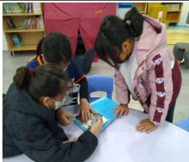
從閱讀中學習防災意識