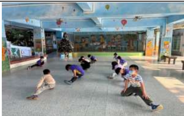
說明：體育活動課程