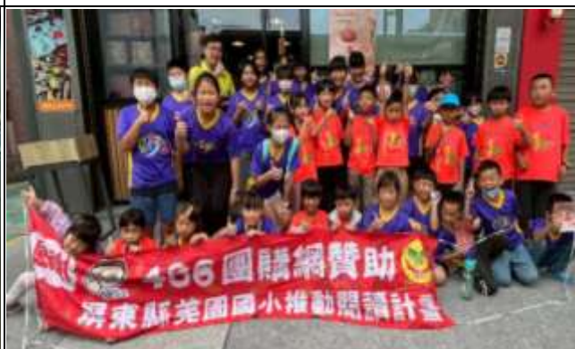
說明：486 閱讀之旅—衛武營兒童劇團欣賞