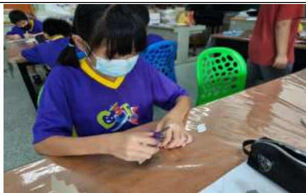
說明：創意面具製作