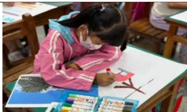
說明：學生參考學校附近實景照進行創作