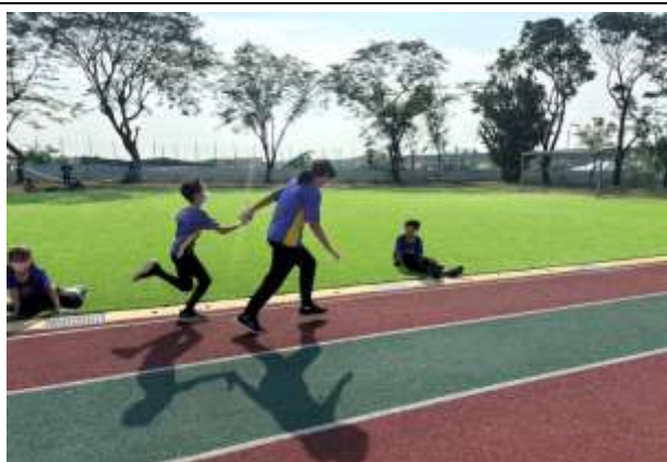
說明：體育活動課程