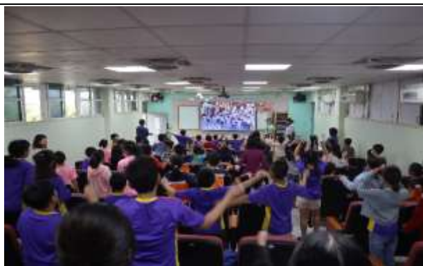
說明：健康宣導時全校一起運動