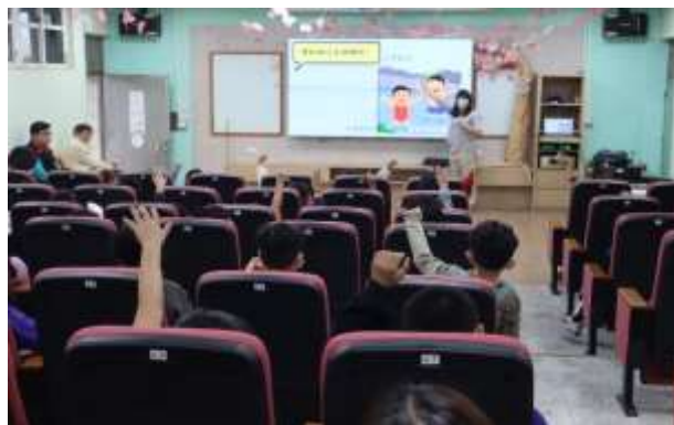
說明：晨間宣導—隱私部位