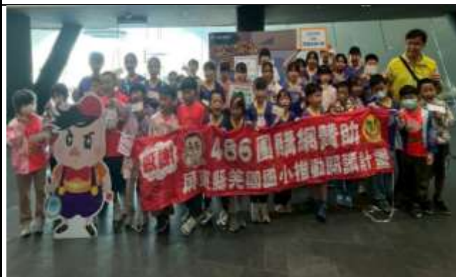
說明：486 閱讀之旅—衛武營兒童劇團欣賞