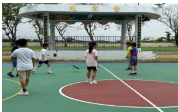
說明：體育活動課程