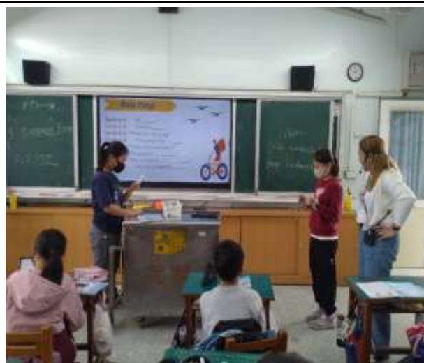
角色演練英語對話