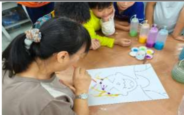
說明：老師示範如何吹畫