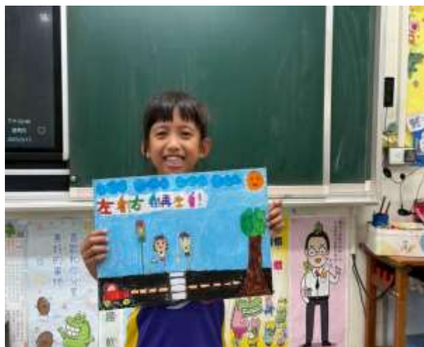
說明：投稿交通安全繪畫比賽作品