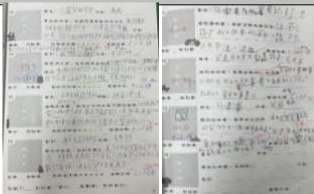
說明：天下雜誌閱讀護照的書寫評比點數