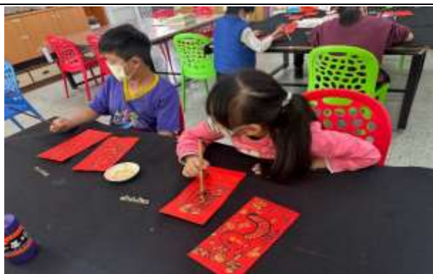
說明：蛇年紅包袋設計