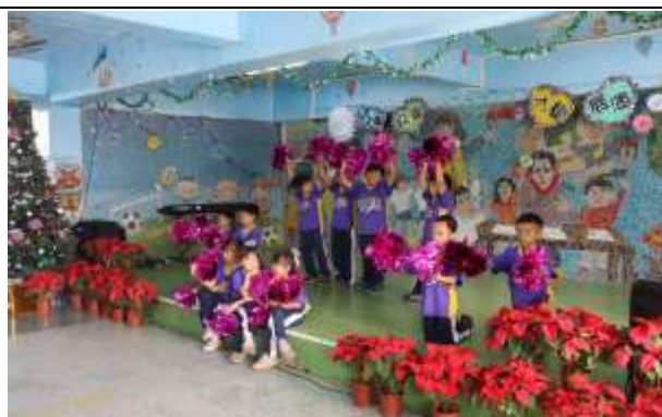
說明：校慶成果展演

(請針對整體課程實踐之省思/課程設計與教學策略之策進方案/未來專業成長規劃與需求……等面向，具體描述，給予回饋)