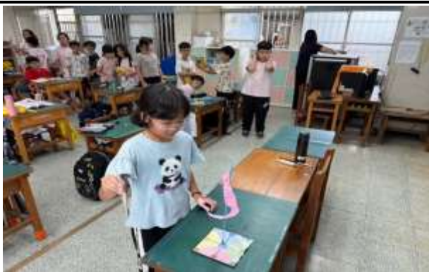
說明：空氣流動形成風