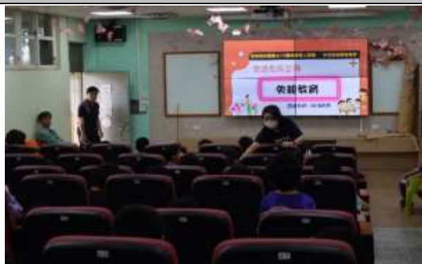
說明：學生回答何謂「失親」