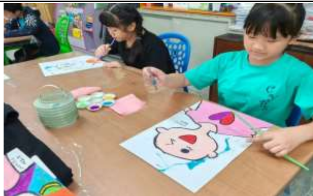
說明：學生進行創作