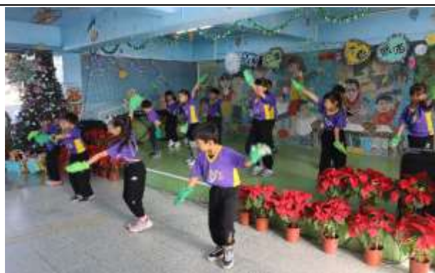
說明：校慶成果展演