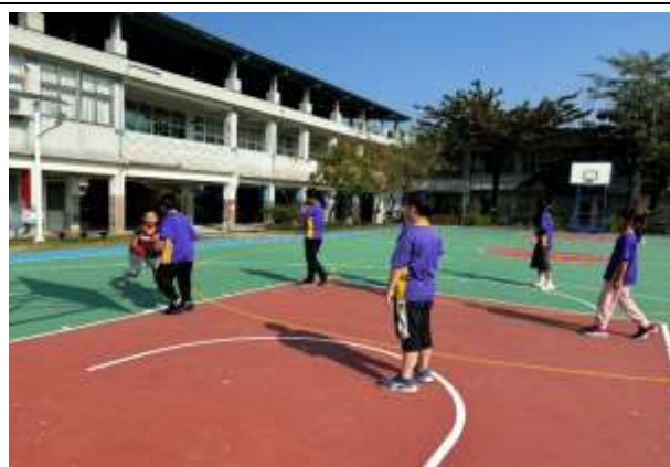
說明：體育活動課程