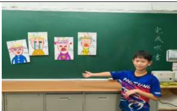
說明：完成喜怒哀樂吹畫