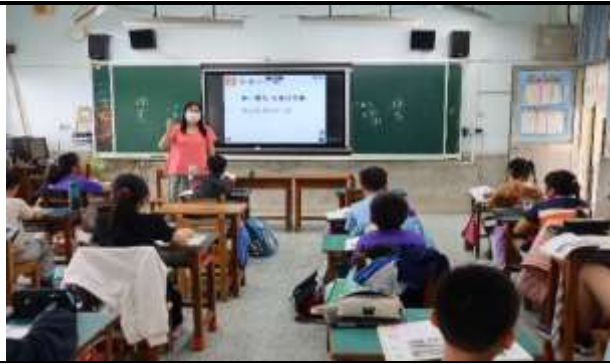
說明：老師介紹各行各業