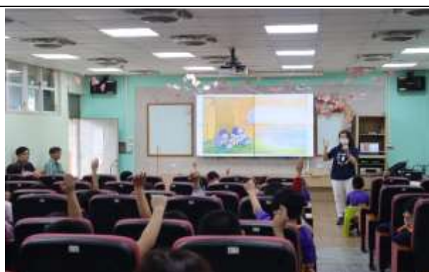
說明：學生分享失親感受