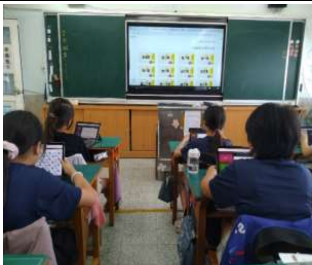
大小學伴英語連線