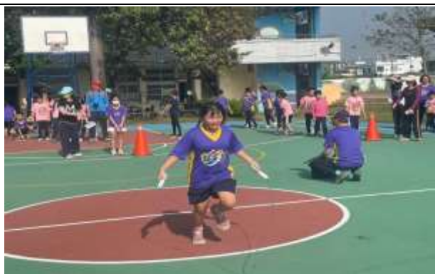
說明：運動會趣味競賽-手腳協調