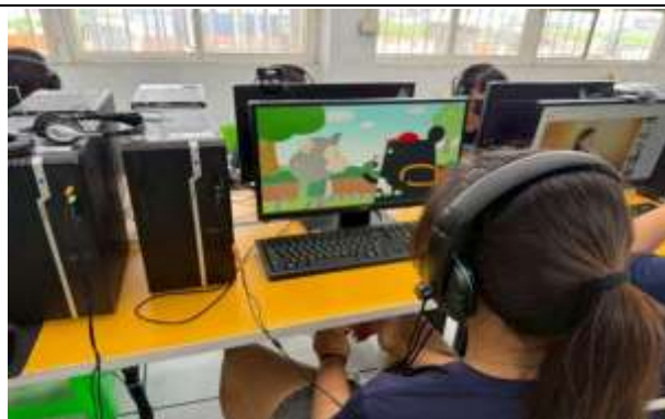
說明：課堂—學生自行搜尋並觀看性平相關影片。