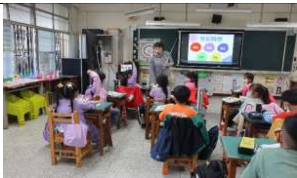
說明：學生發表對特定顏色的感覺