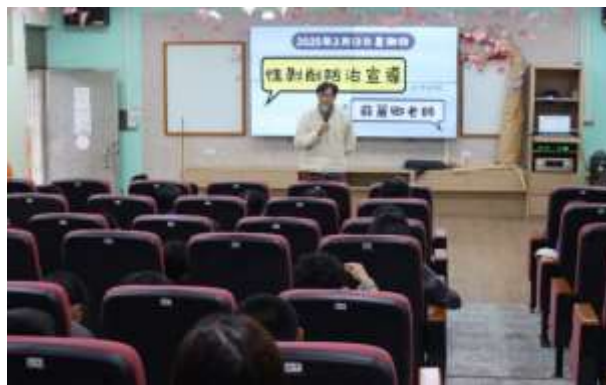
說明：晨間宣導—性剝削