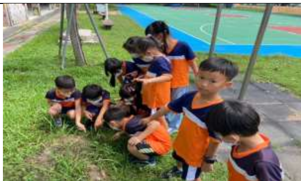
說明：學生觀察校園裡的小動物