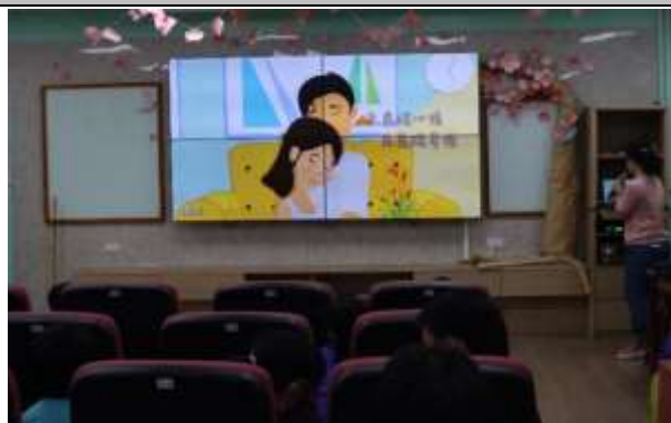
說明：家庭教育宣導