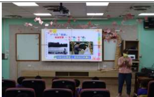
說明：家庭教育宣導