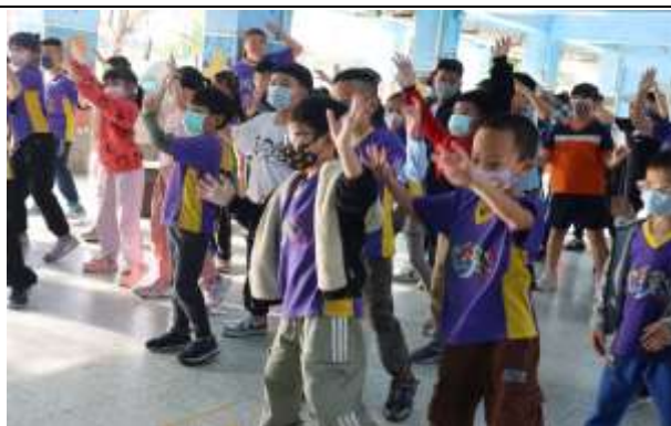
說明：每周的晨間健康操