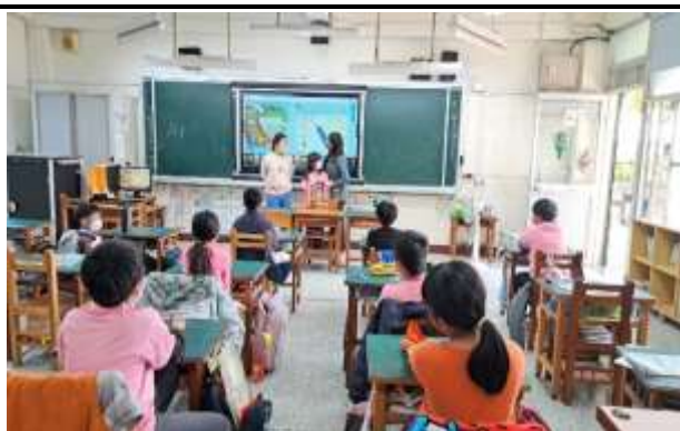
說明：學生上台比較營養均衡的差別