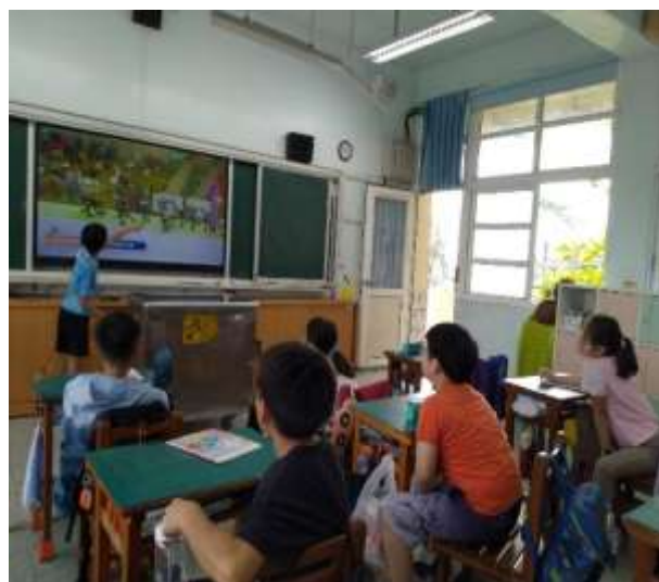
樂於分享自己喜歡的直排輪運動