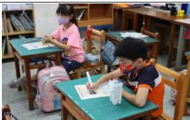
說明：課堂—學習單書寫