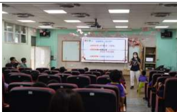
說明：失親教育影片分享