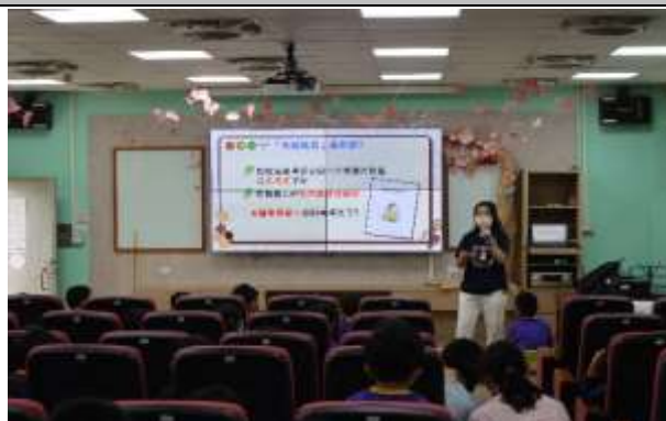
說明：老師說明「失親教育」的意思