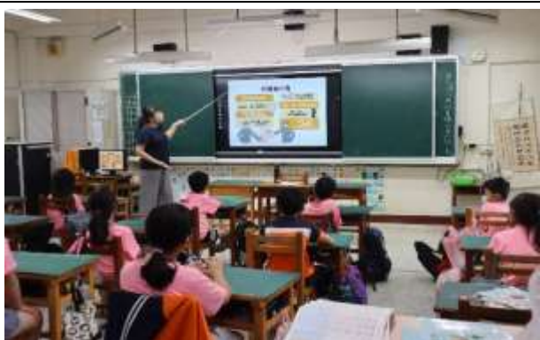
說明：課堂—性騷擾常見樣態