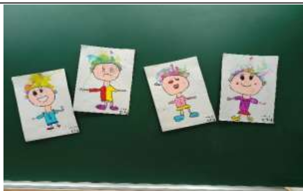
說明：完成喜怒哀樂吹畫