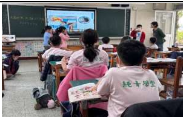
說明：學生分組演練失火時該怎麼通報消防局