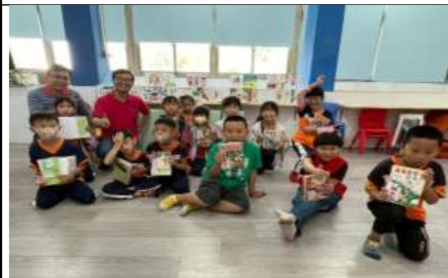
說明：作家有約—作家現場與學童互動