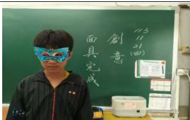
說明：創意面具完成