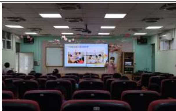
說明：家庭教育宣導

(請針對整體課程實踐之省思/課程設計與教學策略之策進方案/未來專業成長規劃與需求……等面向，具體描述，給予回饋)