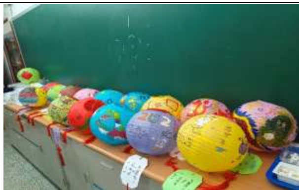
說明：燈籠彩繪設計