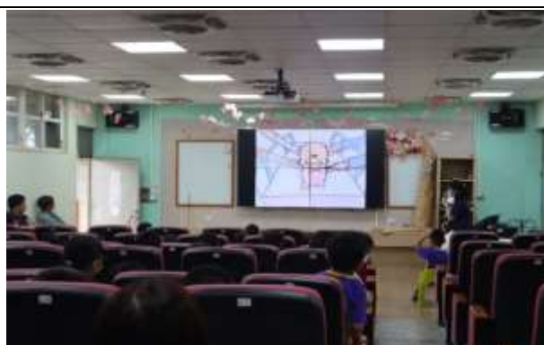
說明：「人的一生」影片分享及講解

(請針對整體課程實踐之省思/課程設計與教學策略之策進方案/未來專業成長規劃與需求……等面向，具體描述，給予回饋)