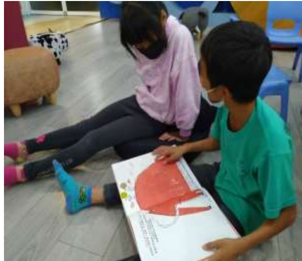
從閱讀中啟發同理心