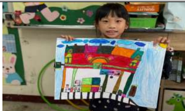
說明：學校附近繪畫創作成品