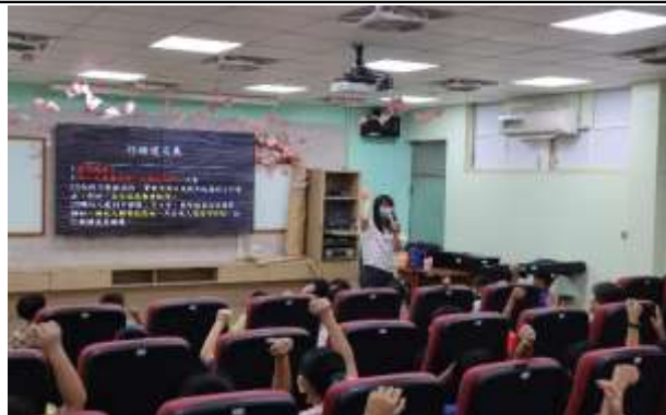
說明：晨間宣導—性騷擾