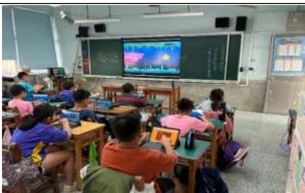
說明：利用 KAHOOT 複習提升學習興趣