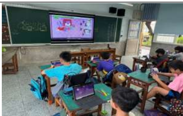
說明：利用 KAHOOT 複習提升學習興趣