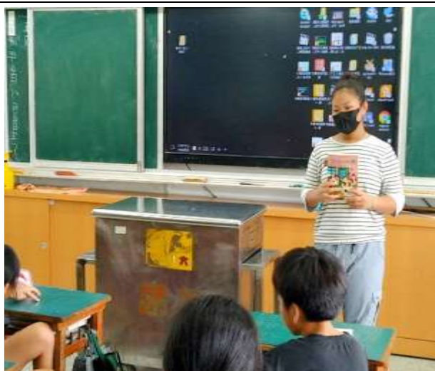
世界閱讀日:介紹書籍