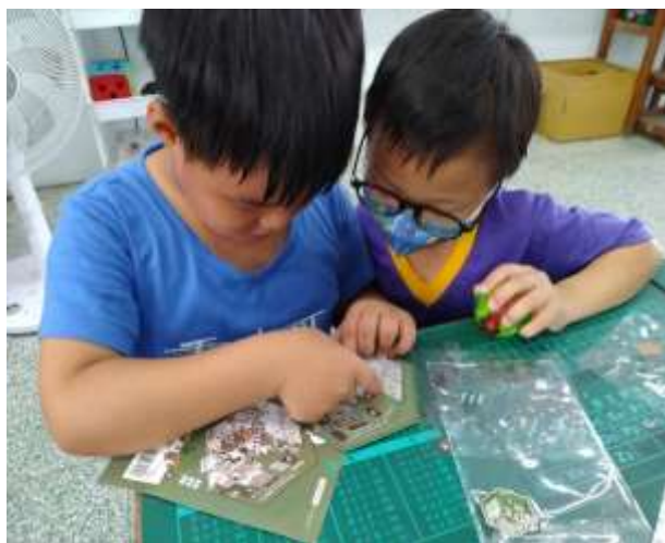
說明：學生彼此交換介紹自己的玩具。