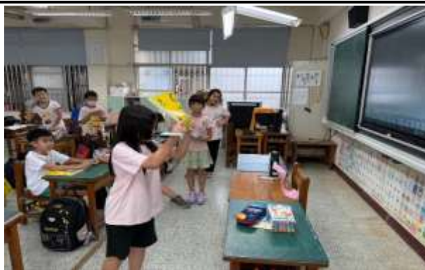
說明：空氣流動形成風