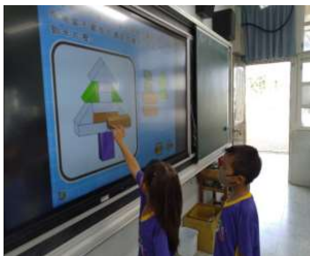
說明：學生利用電子書模擬疊積木。