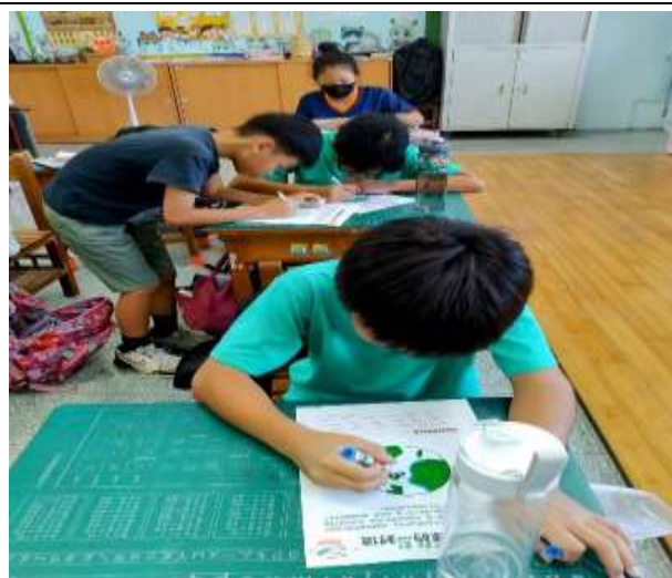
世界地球日:給地球的一封信