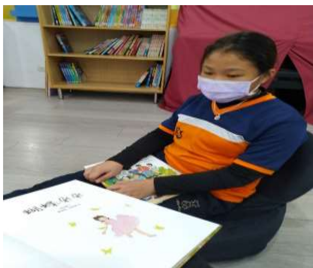
分享性別平等讀本心得