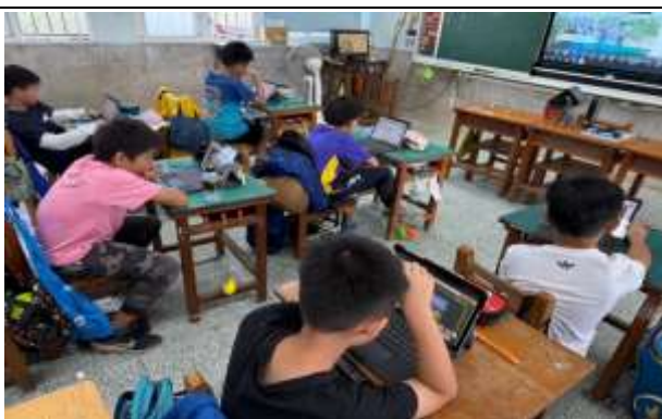
說明：利用因材網加深學習