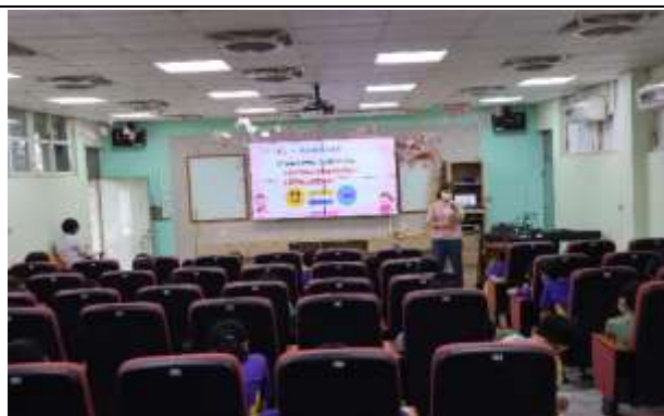
說明：家庭教育宣導