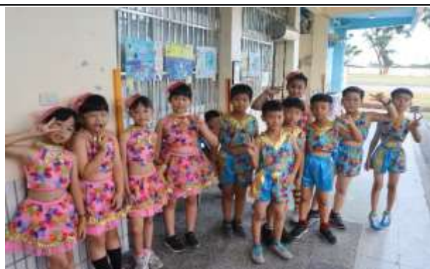
說明：母親節成果展演