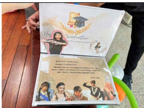
說明：製作雙語畢業帽，給同學祝福