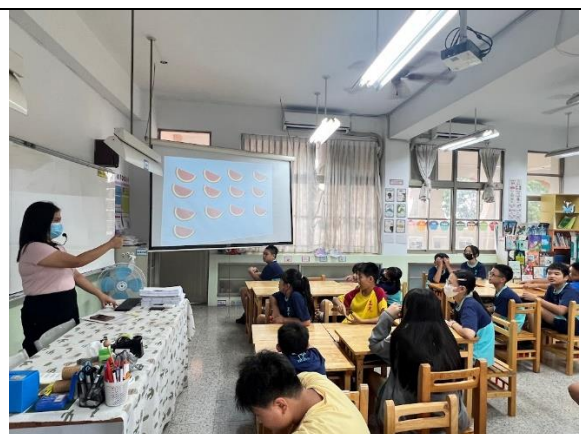
說明：利用活動複習數字