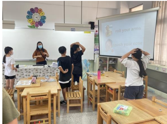
外師教導學生英語順口溜，搭配動作及口語，記得更深刻