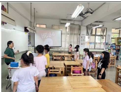
說明：warm up- sing and dance