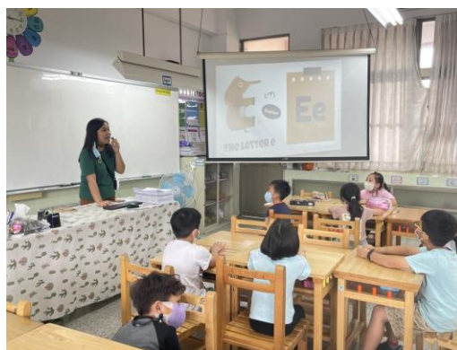
學生與外師互動，學習自然發音