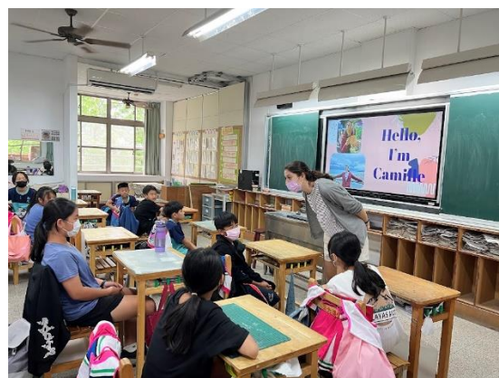
透過提問練習英文口說