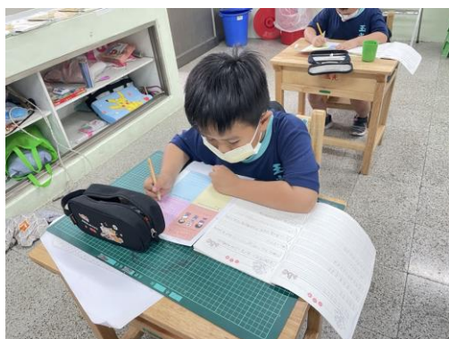
學生製作雙語母親節卡片