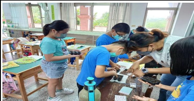
說明：結合跨域自然課程植物的構造