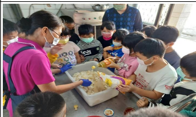
說明：廚工媽媽讓孩子知道從食材到餐桌

(請針對整體課程實踐之省思/課程設計與教學策略之策進方案/未來專業成長規劃與需求……等面向，具體描述，給予回饋)