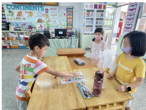
學生利用桌遊練習 health 及 unhealthy