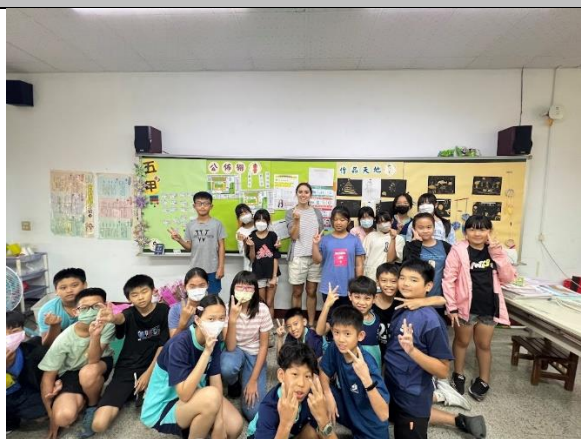
說明：外籍教師課堂: All about me