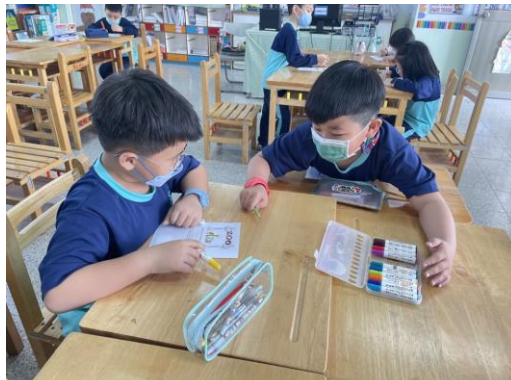
學生製作 animal 小書