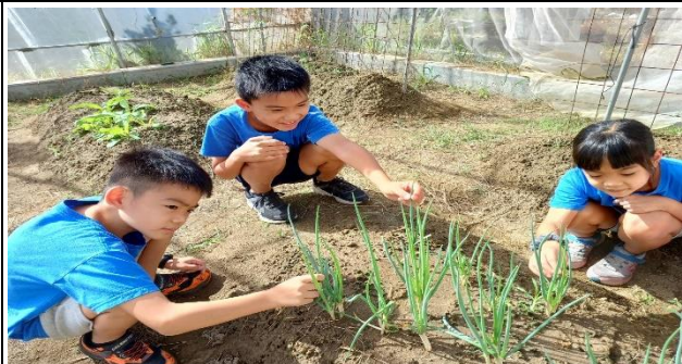
說明：觀察植物生長過程出現的小昆蟲