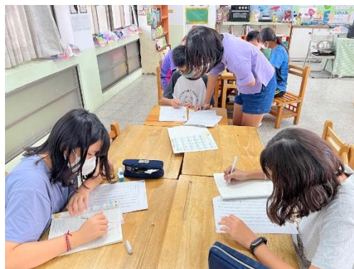
英語單字桌遊小組競賽