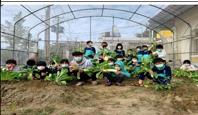
說明：自己動手採收蘿蔔