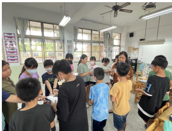
利用小遊戲與同學一起完成對話，好玩又實用