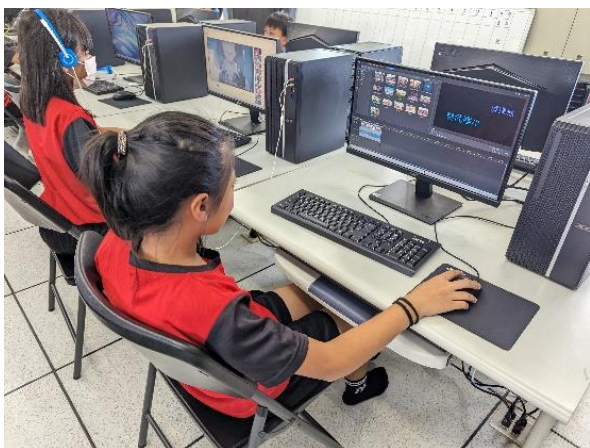
說明：官志老師指導學生學習使用威力導演製作畢業紀念影片。