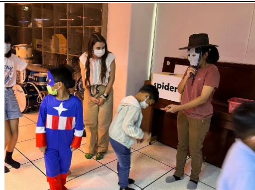
說明：全校參與萬聖節英語闖關活動