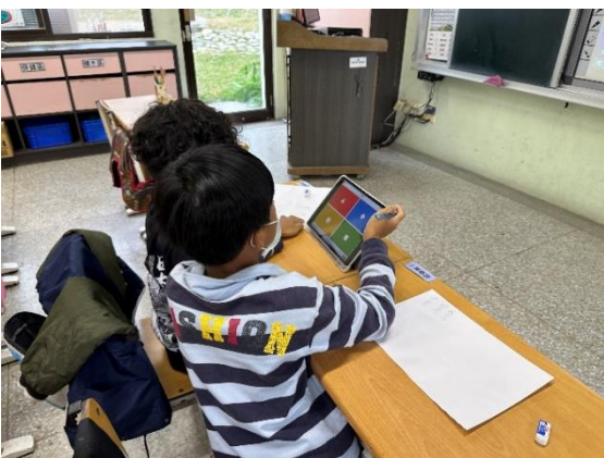
學生依個別需求進行線上學習