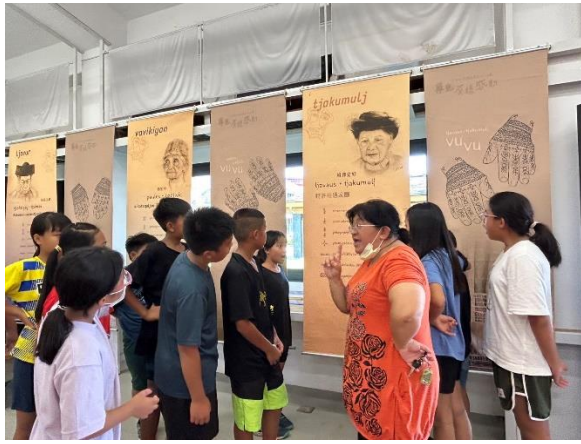
說明：霄鳳老師介紹文手的意義及長輩們的故事-五甲