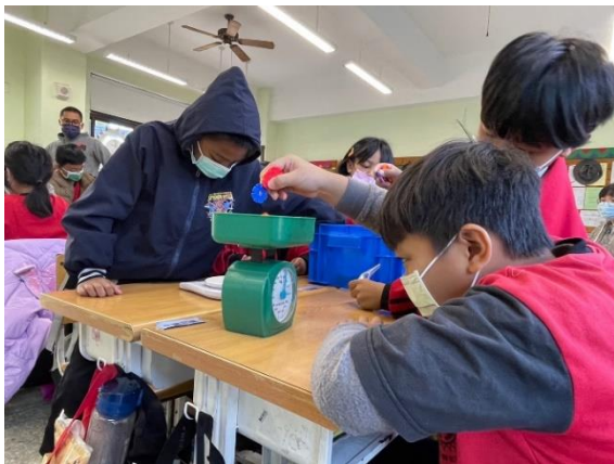
透過操作體驗加深學習概念