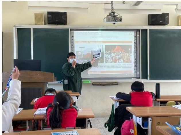
說明：祖兒老師利用投影設備教師介紹台灣的族群-四甲