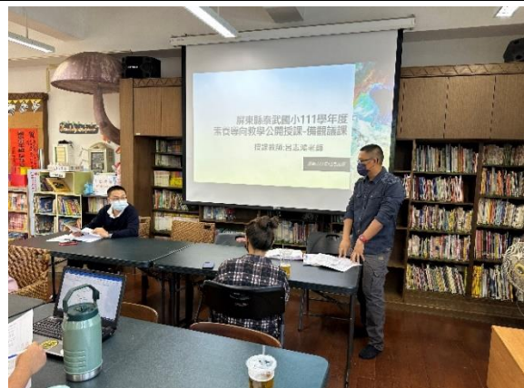
教師參與公開授課研討教學策略