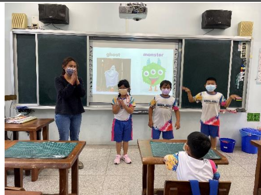
說明：萬聖節英語教學