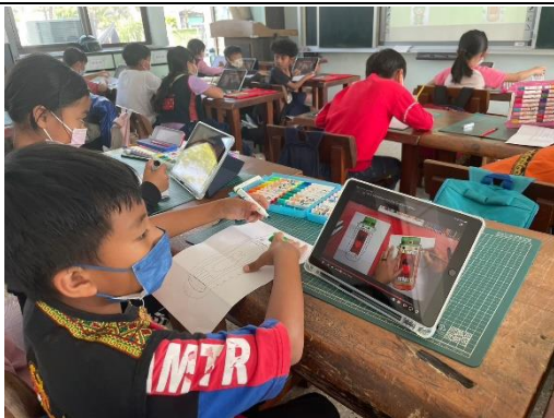
說明：聖派翠克節運用平板完成學習單