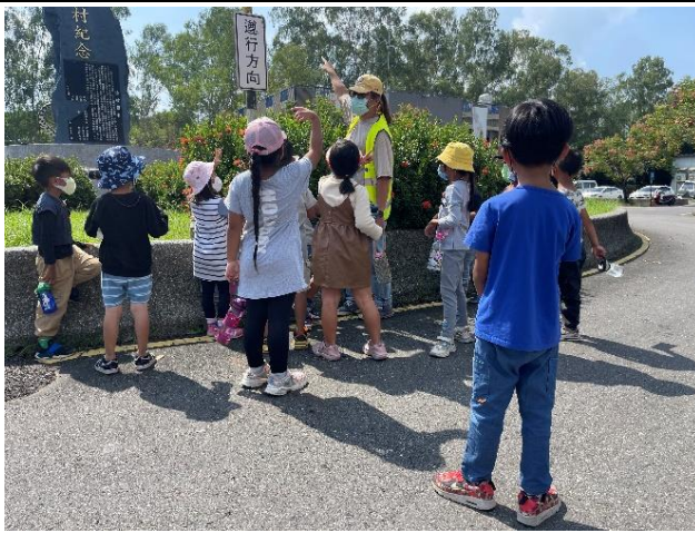
說明：椿樺老師帶學生到社區裡認識部落交通號誌-一甲