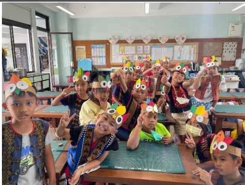
說明：感恩節火雞帽 DIY