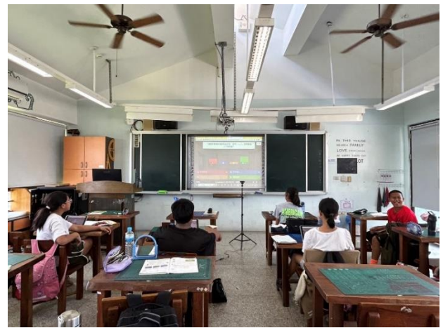
說明：家蓁老師運用 kahoot 提高學生學習動機及進行學習評量-五甲