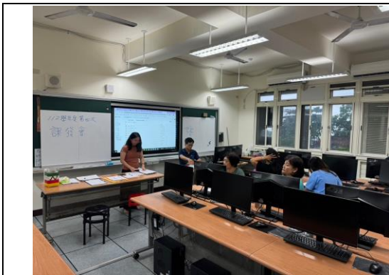
說明：審查 113 學年課程計畫。