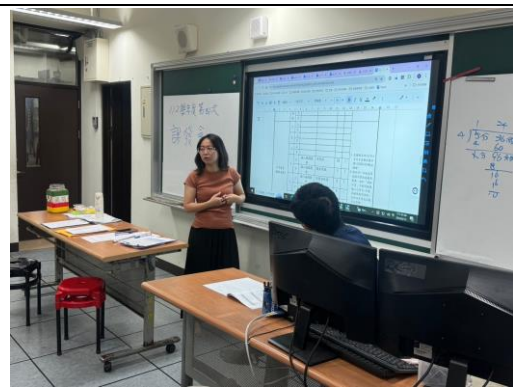
說明：討論課程內容。