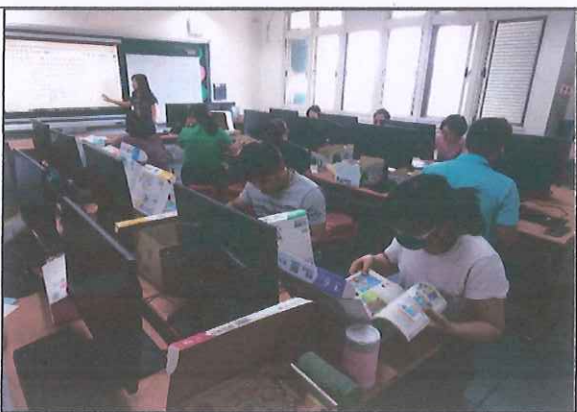
說明：教導主任主持選用教科書情形