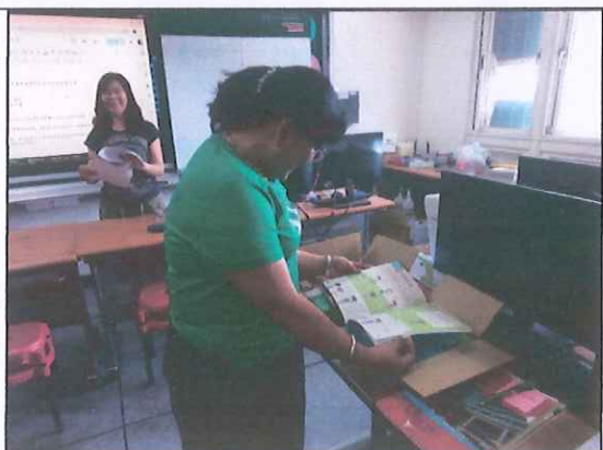
說明：教師選用教科書情形