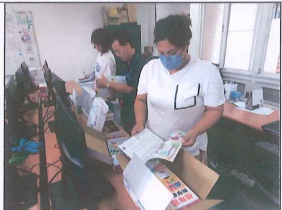
說明：特教生家長代表選用教科書情形