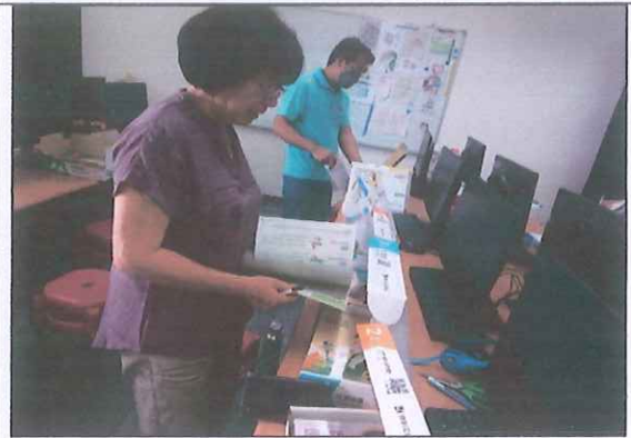
說明：教師選用教科書情形