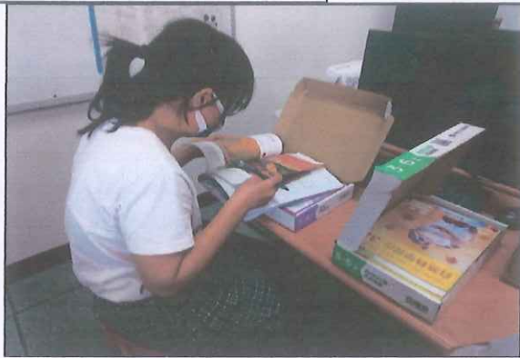
說明：英語專任教師選用教科書情形