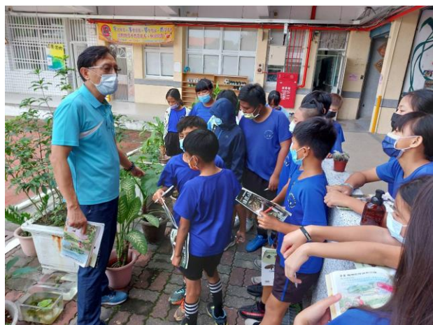
說明：植物辨識分類教學