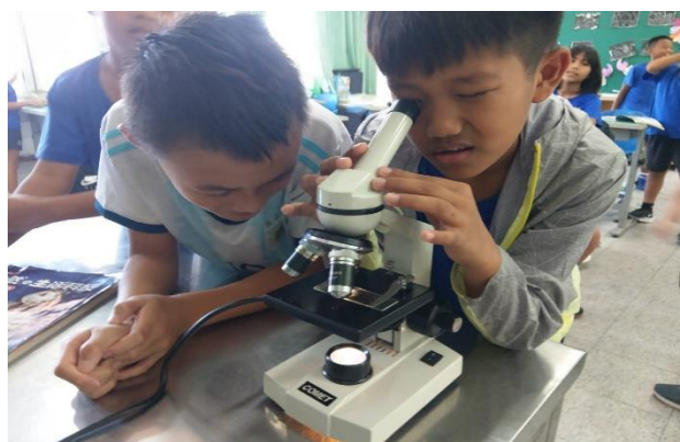
說明：指導學生操作顯微鏡觀測毛髮