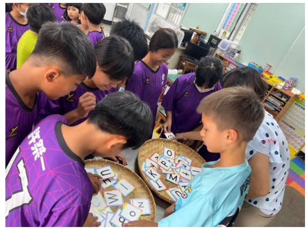
說明：課堂活動—字母教學