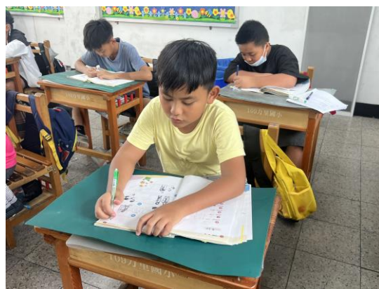
說明：學生拼讀句子