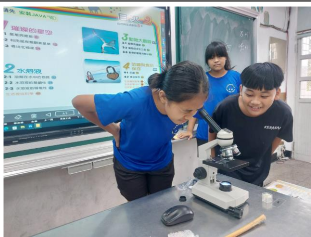
說明：顯微鏡操作教學進行實際操作