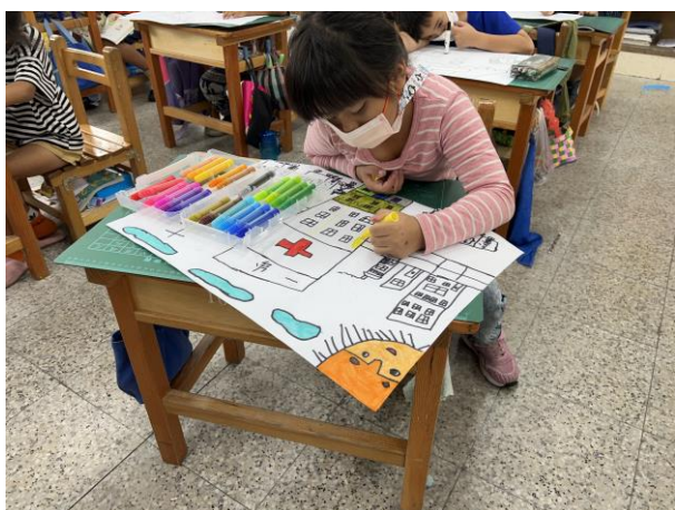
說明：繪製我家附近