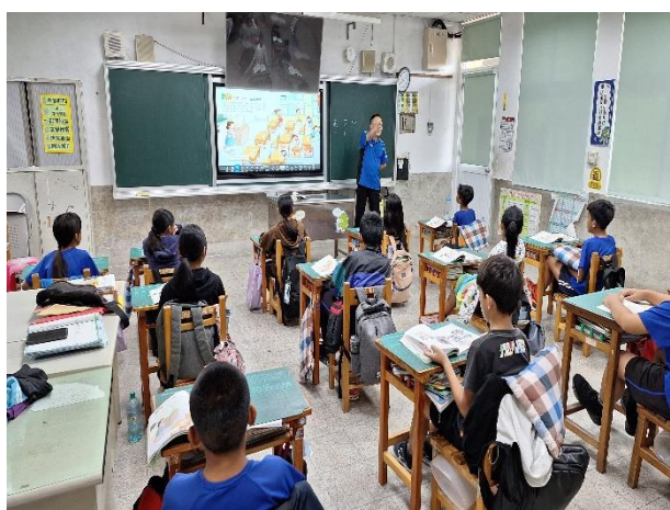
說明：天搖地動課程