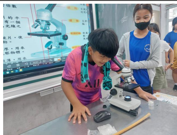
說明：顯微鏡操作教學進行實際操作