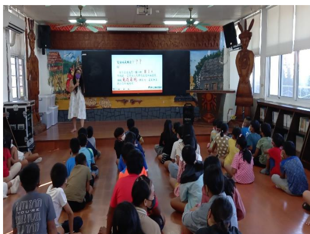
說明：愛滋防治宣導