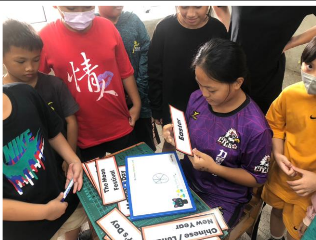
說明：課堂分組活動