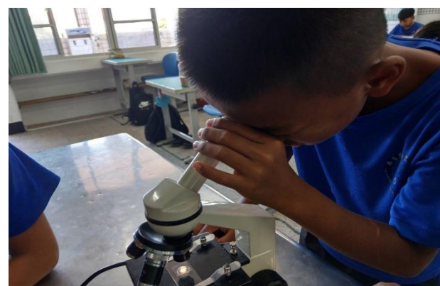
說明：指導學生操作顯微鏡觀測毛髮