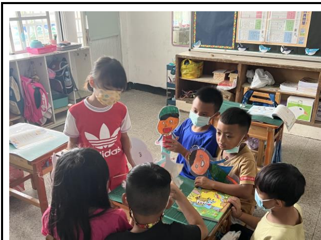
說明：皮影戲手偶操作練習