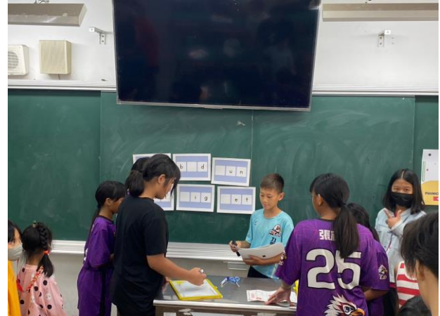
說明：課堂活動—發音教學分組任務