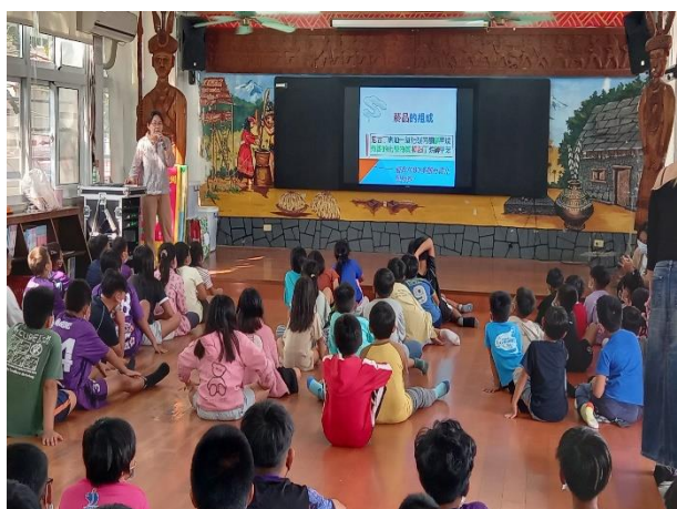
說明：健康促進宣導