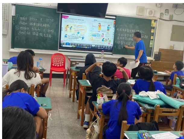
說明：全民健保課程