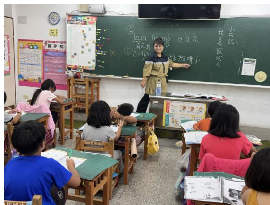
說明：講解句型及音節