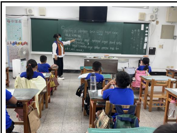
說明：複習句子拼音練習