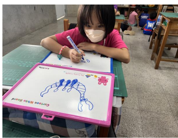
說明：配合節慶-畫一畫、猜一猜