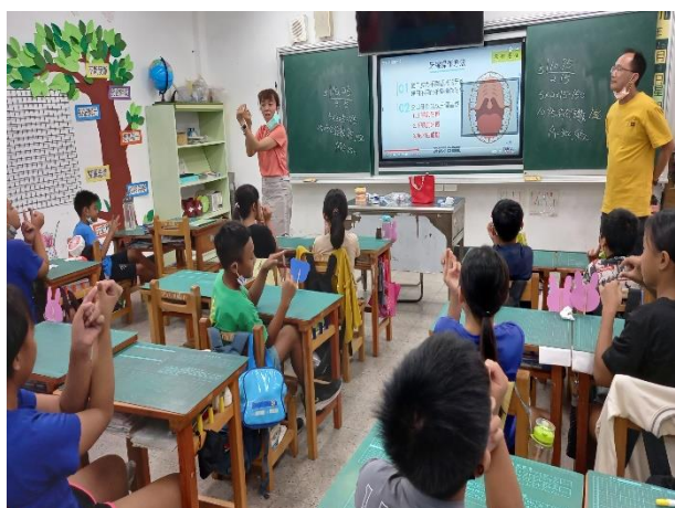
說明：正確牙線操作課程