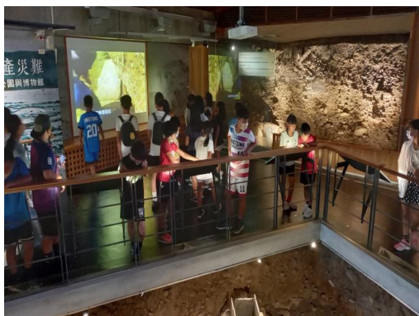
說明：校外參訪卑南文化遺址公園