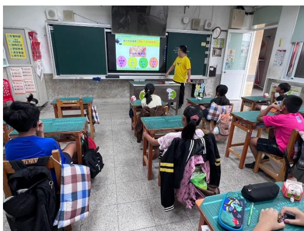
說明：電子菸防治課程