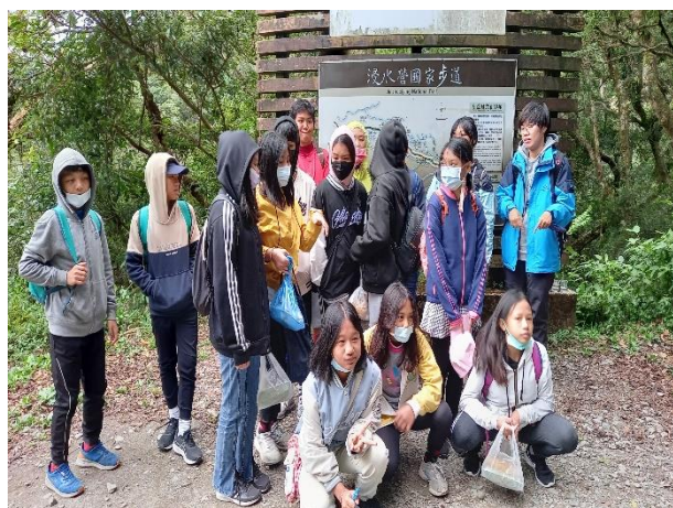
說明：浸水營古道踏查