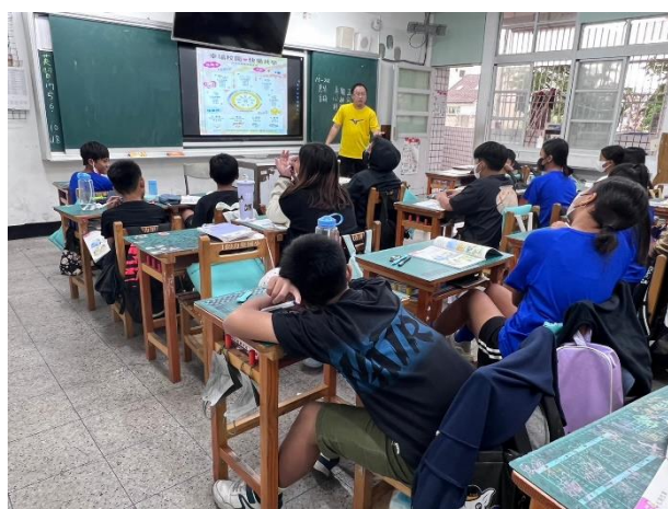
說明：正向心理健康課程