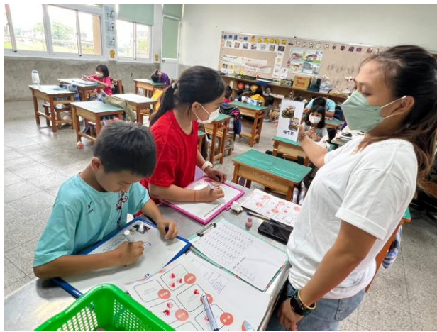
說明：課堂活動—節慶教學