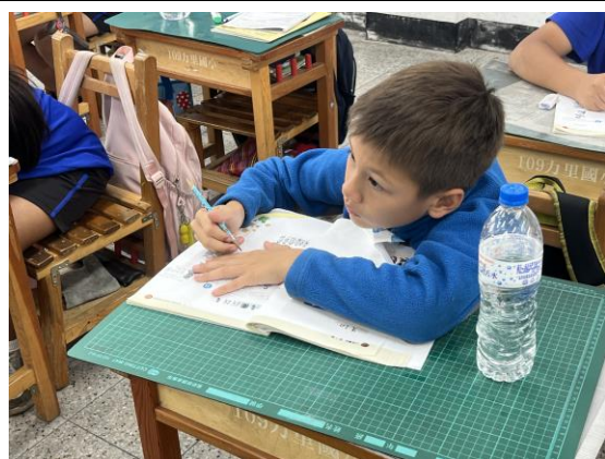
說明：同學把看圖說話的例句抄寫下來