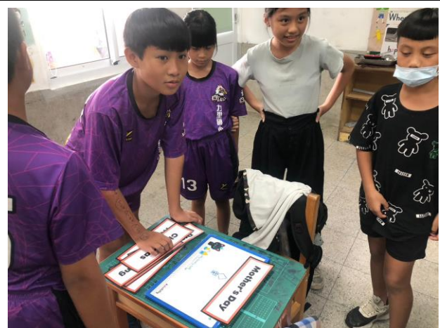
說明：課堂分組活動