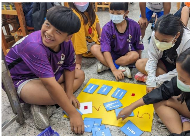
說明：單字配對教學活動