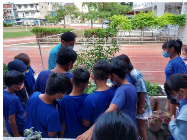
說明：植物辨識分類教學