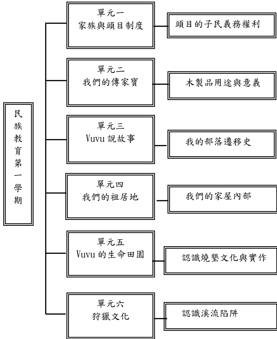
113 學年度民族教育課程架構表