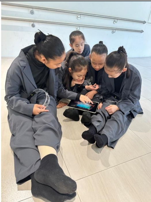
說明：ipad 融入現代舞蹈學習