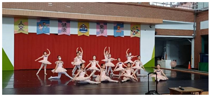
說明：芭蕾舞課程~練習舞展表演舞碼