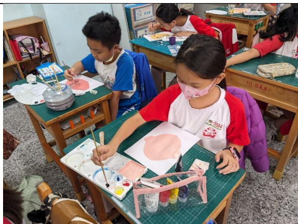
說明：練習彩繪臉譜