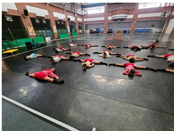
說明：舞蹈課前一定要暖身活動