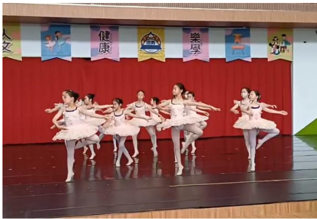
說明：芭蕾舞課程~跳出芭蕾舞優美又典雅的感覺