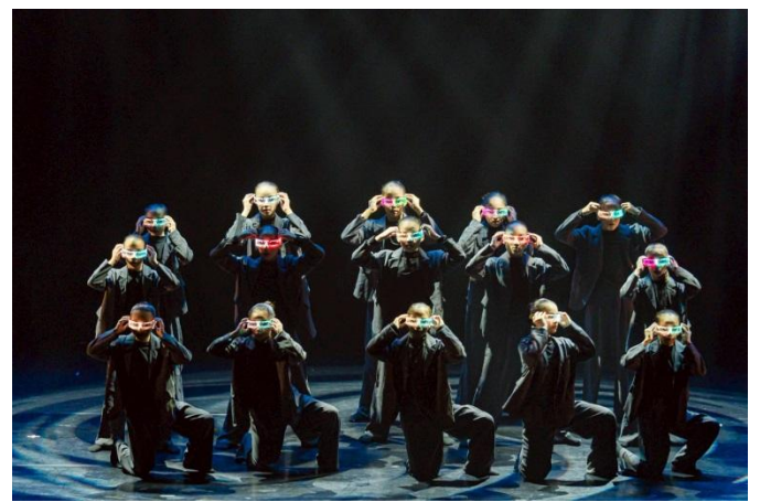
說明：現代舞成果發表