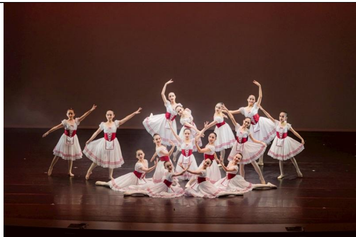
說明：芭蕾舞成果發表