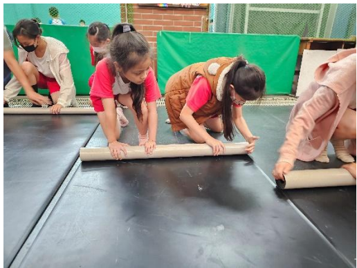
說明：活動後的場地收拾