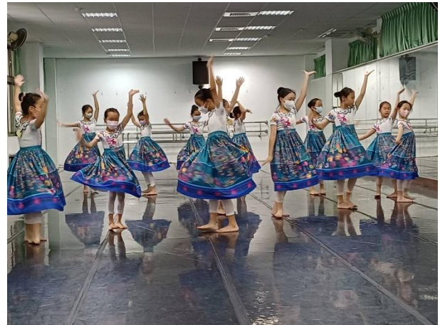
說明：現代課程~練習舞展表演舞碼