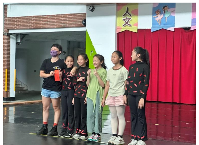
說明：即興成果發表