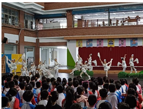
說明：校內活動表演