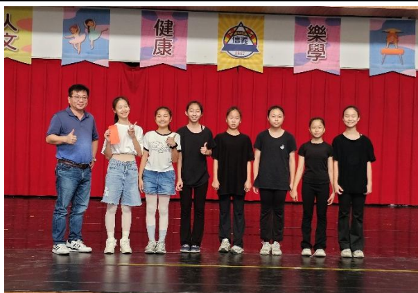
說明：分小組進行創編舞蹈比賽