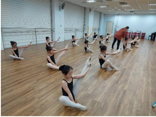
說明：民族課程~基本功訓練不可缺，練功也是毅力訓練