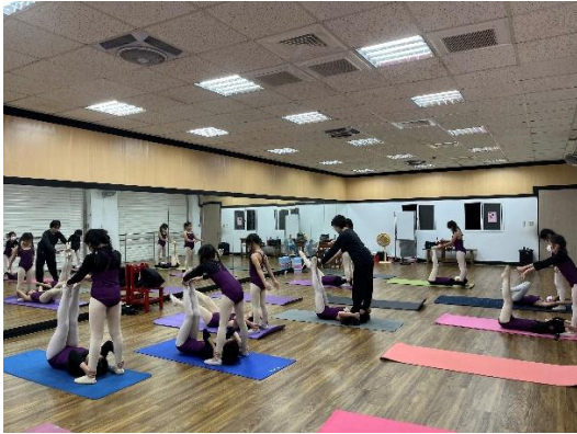
說明：老師示範動作並互相練習