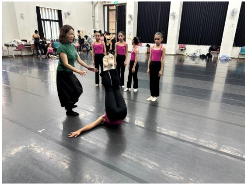
說明：民俗舞基本功練習