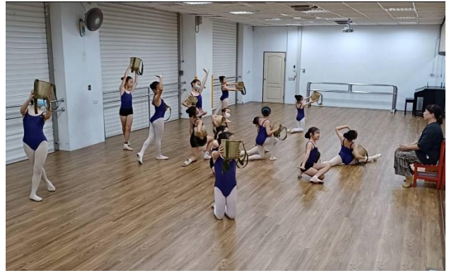
說明：民族課程~練習舞展表演舞碼