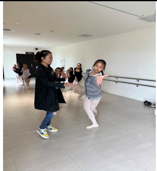
說明：民俗舞基本功練習