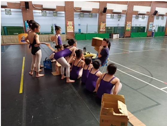
說明：即興課程~舞台設計規畫與運用