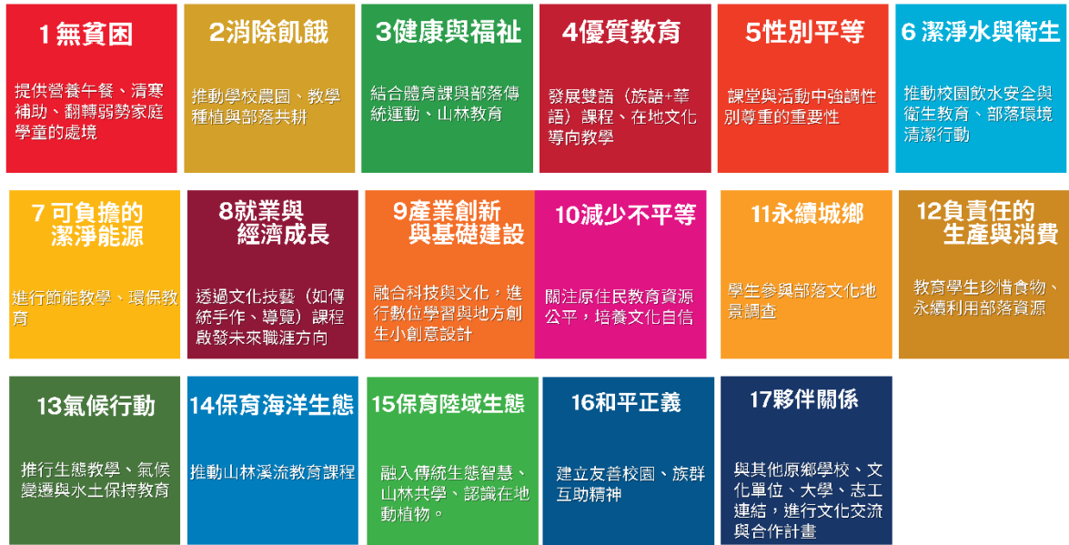
圖 2 泰拉慶本位 17 項永續發展目標 SDGs