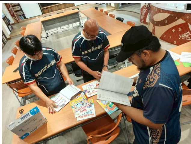
三至六年級英語科