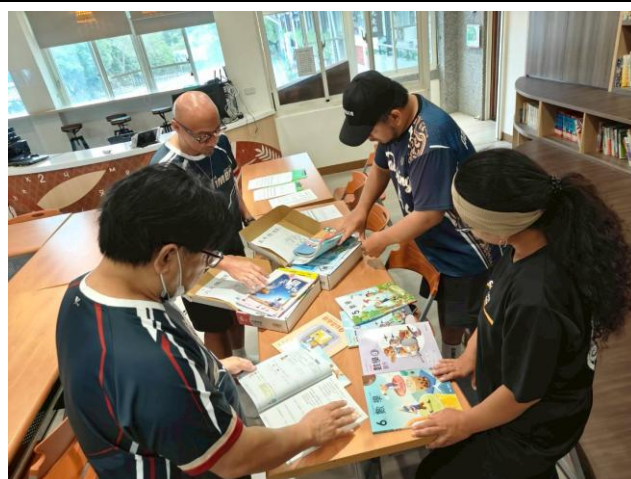
五、六年級國語及數學科