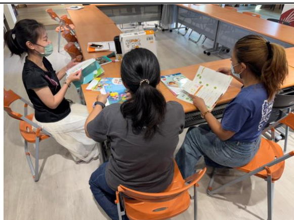
一、二年級國語及數學科