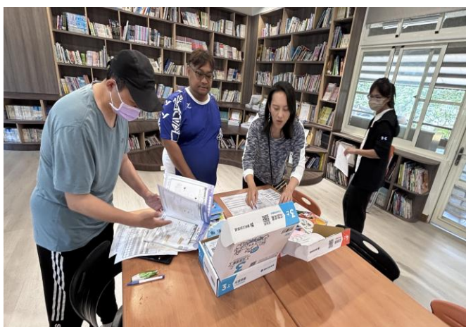
三、四年級國語及數學科