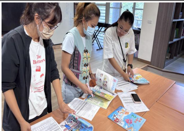
一、二年級健康與體育科