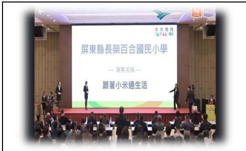
小米相關課程方案獲獎