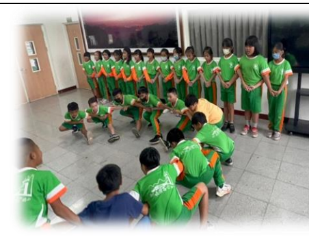
中年級課程實踐分享