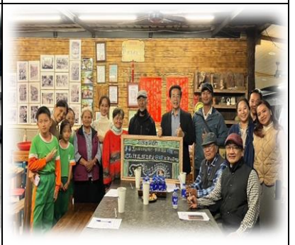
高年級課程實踐-生命回溯與 部落對話