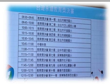
台灣永續教育獲獎