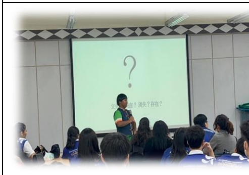
部落議會議長對外課程分享 (泰國大學生)