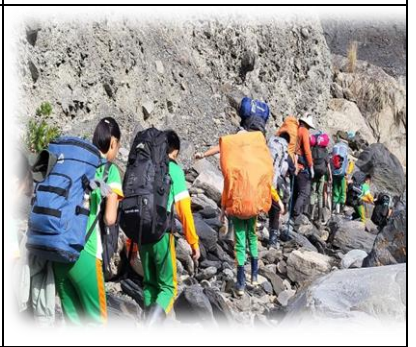
高年級課程實踐-生命回溯