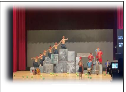
全國族語戲劇競賽學生組榮獲 第三名