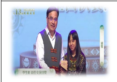
獲最佳男演員獎、最佳女演員獎