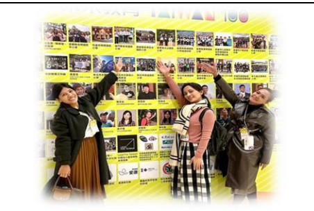
小米相關課程方案獲獎