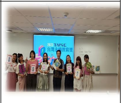
參與台灣永續教育