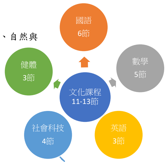
圖7 長榮百合111學年民族文化課程規劃

、探究學習相結合。目前民族教育課程採文化主題統整的模式來發展課程，以歌謠、農耕、文學、建築、狩獵和祭儀為主軸，規劃24個單元主題內容。這六大主軸，是一般教育學科領域所沒有的，可以補足原住民族教育之所需要的。然而課程與教學，盡量採以統整的取向，