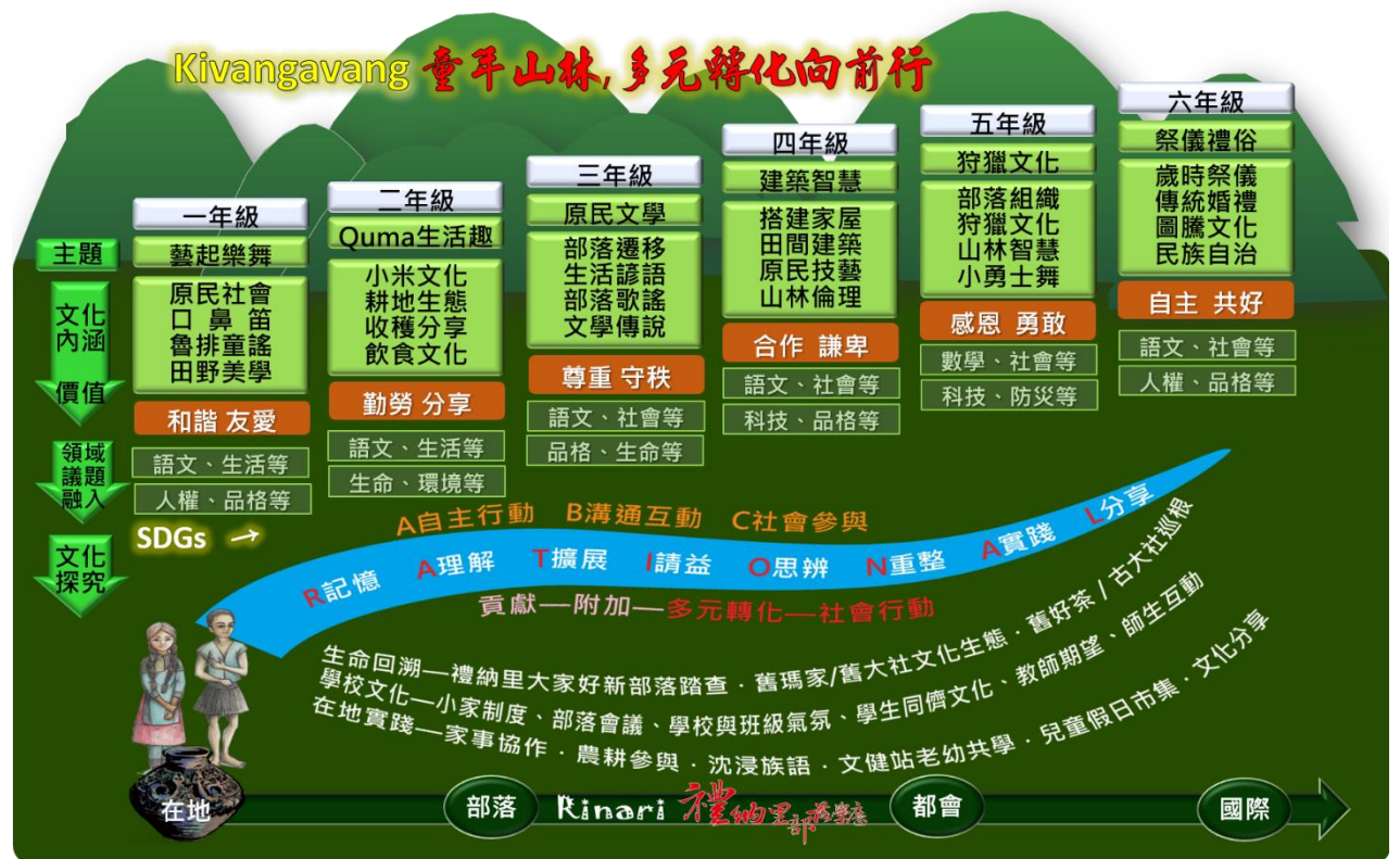
圖 6 校本課程架構圖

校本課程包含正式課程、非正式課程、潛在課程；保有主學科領域的教學之外，為保障文化主體性，圖 6 所示的主題課程係以民族文化為主，藉由部落老師與協同教師的引導，讓學生可以操作、理解與探索，進而瞭解文化深層的意義，也輔以生命回溯課程，讓學生置身族群共有的歷史生命之河中，更有感地透過實際部落與舊部落來領略生命的軌跡。耆老的教學即便可以達到預期目標，然而族群的精神與靈魂才是傳承之鑰，實非易事，需要透過領域融入與文化研究讓學習者自我建構。